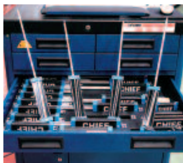
Tarjetas de medición