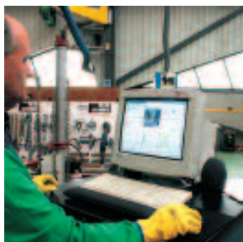
Ordenador y software de gestión

El equipo informático se encuentra situado en un armario metálico, con diferentes compartimentos para cada uno de los accesorios del equipo. El software de gestión de la medición instalado es el denominado Genesis II Electronic Measuring .