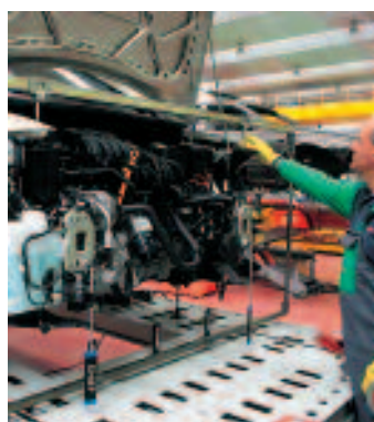
Colocación de las regletas

Tras introducir los datos de identificación del vehículo, se deben elegir cuatro puntos de la carrocería, de forma que el medidor establezca los planos necesarios para la medición. Para ello, se colocarán en los cuatro puntos elegidos las regletas indicadas por el medidor, introduciendo en primer lugar los dos de delante o los dos de detrás. De esta forma, se sitúan los puntos llamados "cero" de la medición. Cuando la calidad del centrado no se corresponda con los estándares preestablecidos en el programa, el medidor lo indicará en la pantalla con un mensaje de texto, recomendando la posibilidad de realizar un centrado con sólo tres puntos.