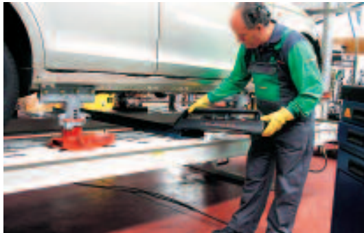
Colocación del explorador

→ El medidor electrónico de carrocerías Velocity , de Chief, realiza el control de la carrocería a través de la inspección de diversos puntos del vehículo, tanto de aquellos situados en la propia plataforma como los de su parte superior (es el caso de los puntos de la torreta de la suspensión). El sistema de medición y el utillaje empleado permiten su uso en cualquiera de los equipos de reparación y estiraje existentes en el mercado, dada su gran versatilidad.