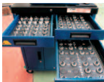
Útiles de sujeción