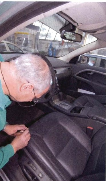
► Reparación de tapicería de cuero