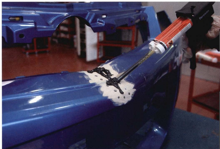
▶ Reparación de plástico mediante adhesivo