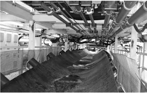
Figura 2. Cintas transportadoras de material excavado