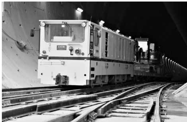
Figura 3. Sistema ferroviario de un túnel para transporte de personal y material al frente de excavación