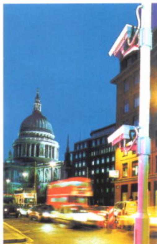
Punto de salida del Cordón de Seguridad