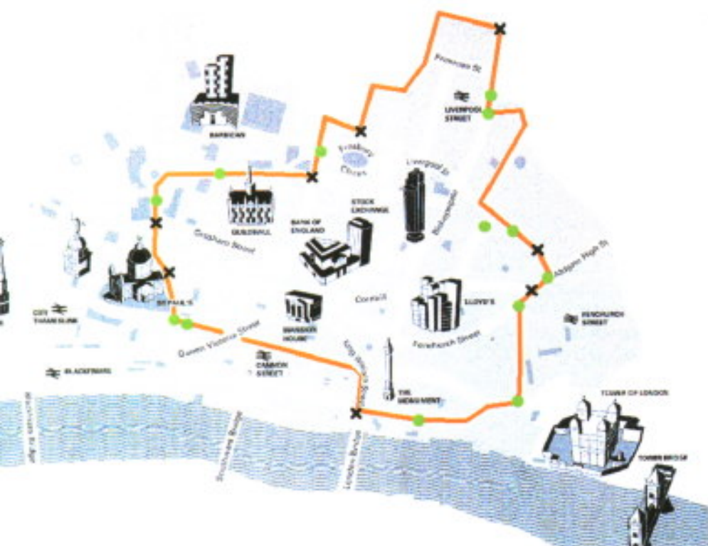
Cordon de la City: Puntos de entrada (X) Puntos de salida (O)