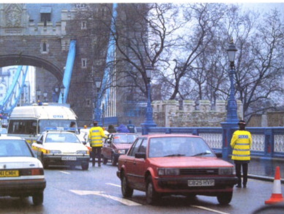
Un control en plena City