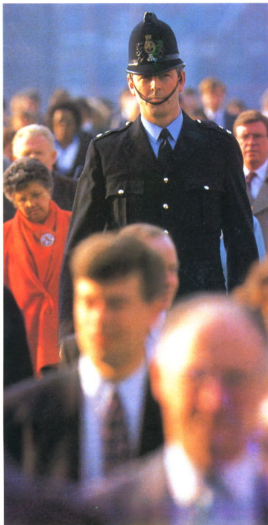
Policía de la City, todo un símbolo

ger, se estudió el tráfico y se establecieron 8 puntos de entrada y 12 puntos de salida. Posteriormente se instalaron cámaras exteriores de televisión en cada uno de estos puntos, que mediante fibra óptica transmitían las imágenes de una forma centralizada a una Sala de Control de la Policía.