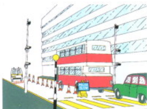
Punto de entrada del Cordón de Seguridad

tarias, locales y público en general, están totalmente de acuerdo y a favor de este tipo de vigilancia electrónica, impresiones a las que hay que sumar las estadísticas policiales de los últi-