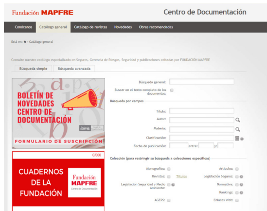
Imagen 5: Página de inicio CDOC-FM