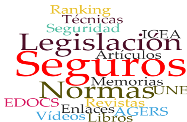
Imagen 2: Colecciones del catálogo

En la actualidad el CDOC-FM dispone de más de 150.000 referencias bibliográficas, divididas en diferentes colecciones. A continuación, aparecen los principales datos en relación a la colección: