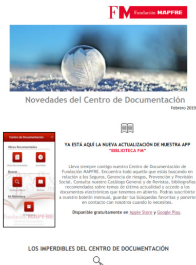
Imagen 6: Portada Boletín Mensual