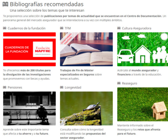
Imagen 4: Bibliografías recomendadas