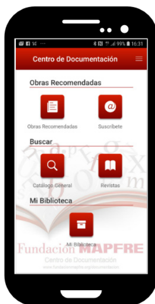
Imagen 1: Aplicación Móvil “Biblioteca FM”

Con todo esto hay que destacar, además, que el CDOC-FM es un centro único en su especialización situándole en un lugar privilegiado de reconocido prestigio a nivel internacional, especialmente en países de habla hispana y portuguesa.