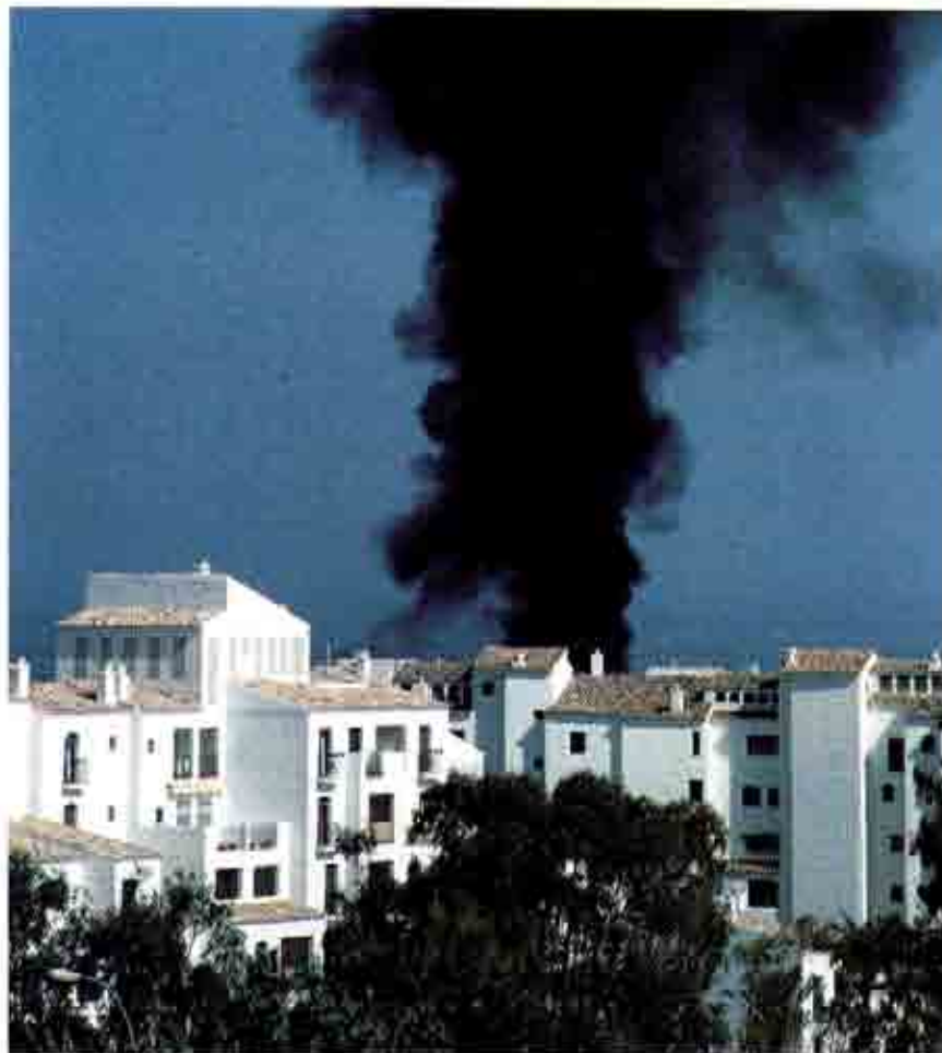
El efecto de los humos y gases tóxicos sobre las personas depende en gran medida de las condiciones físicas individuales.

De experimentos a escala real se han obtenido las siguientes conclusiones respecto al tiempo disponible para evacuación cuando se utilizan materiales retardantes: