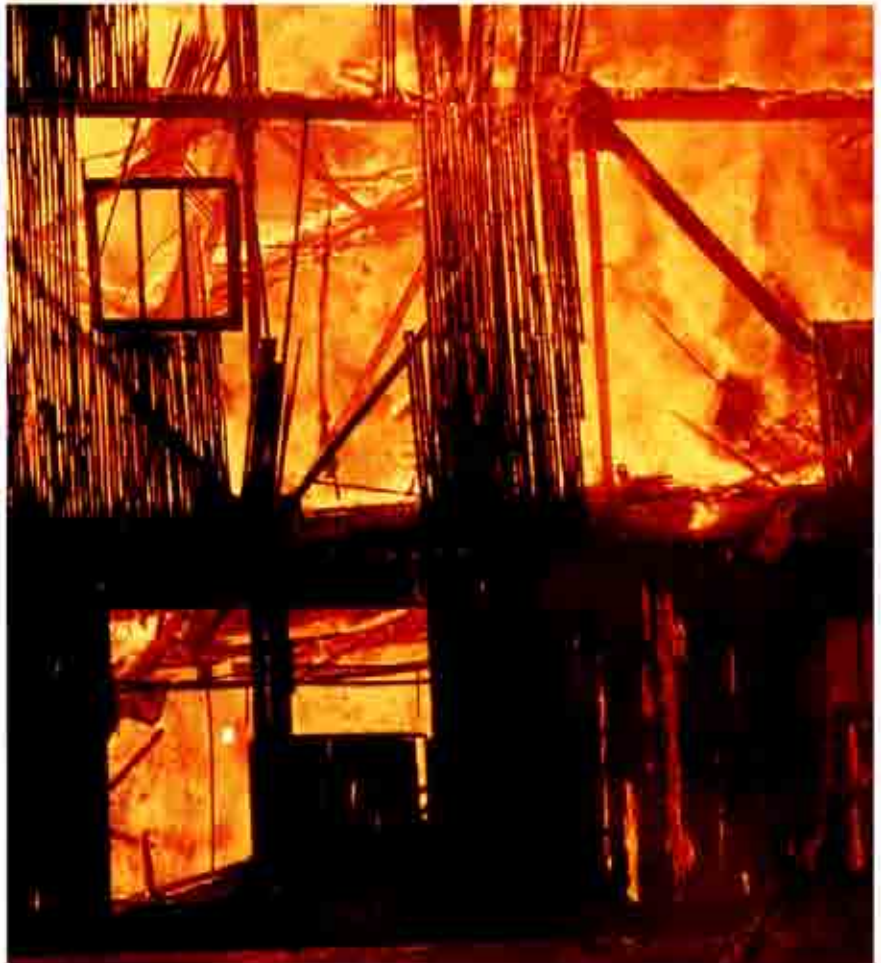
Los incendios pueden clasificarse en distintas categorías atendiendo al tipo de combustión.

En los últimos años se ha producido un gran aumento en la utilización de espumas de poliuretano, tanto para su utilización en elementos de mobiliario (todo tipo de tapizados, colchones), donde prácticamente han desplazado por completo a otro tipo de materiales, como en el campo de la construcción como aislante térmico y en equipos frigoríficos y eléctricos. Resulta obvio que en cualquier vivienda o local público en la actualidad es posible encontrar elementos compuestos por espumas de poliuretano. Por ello resulta de sumo interés establecer cómo responderían dichos ma-