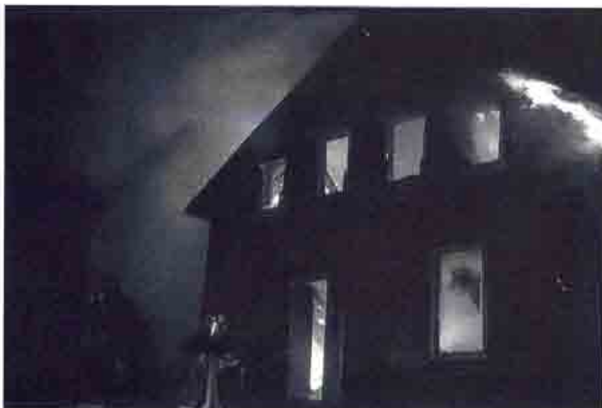
Las personas no suelen saber que un fuego pequeño crece con velocidad exponencial y se transforma rápidamente en un incendio peligroso para la vida.

El uso del edificio y su morfología condicionan en parte el tipo de incendio, así como las medidas preventivas a tomar. En la tabla 1 se resumen las actividades más frecuentes en es-