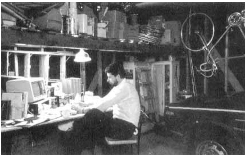
El teletrabajo puede ser un medio más de generar trabajo en condiciones precarias y de explotación.

Es inobjetable que existe un mercado objetivo por explotar cuyas necesi-