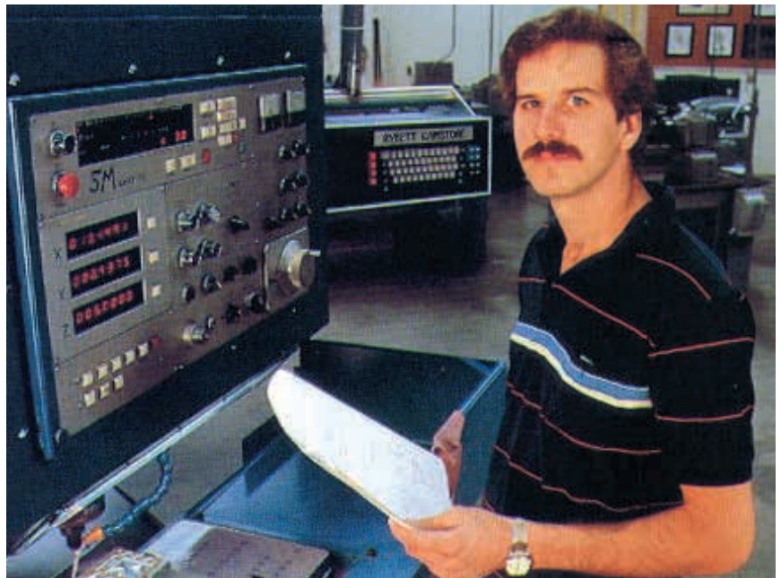
No es teletrabajo aquel que supone un contacto constante o el empleo de maquinaria y herramienta compleja de grandes dimensiones.

Pueden desaparecer la promoción y el estatus, los cauces de comunicación y participación que afectan a la empresa, los sistemas de formación, de motivación, etc. Uno de los problemas que se puede plantear en el caso de teletrabajadores por cuenta aje-