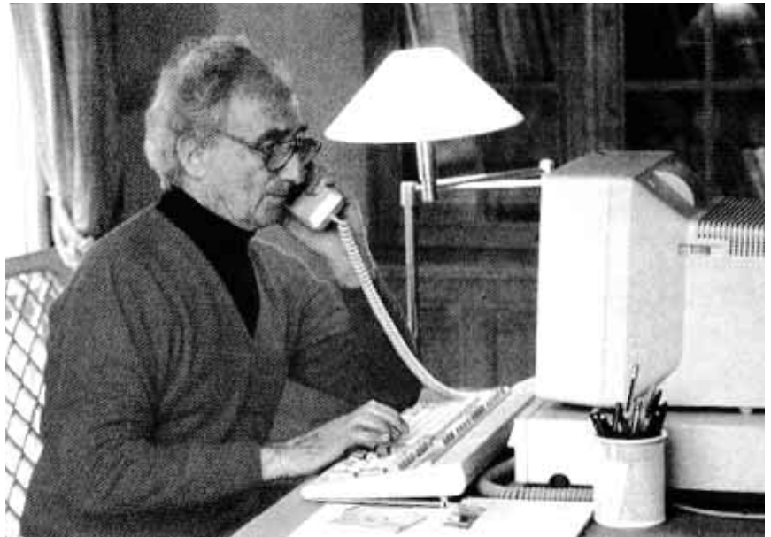
El teletrabajo se puede definir como una forma flexible de trabajar, lejos del empleador y del lugar tradicional de trabajo.

– Mayor productividad al ahorrar tiempo de transporte y tiempo no productivo consecuencia de las relaciones interpersonales dentro de la empresa.