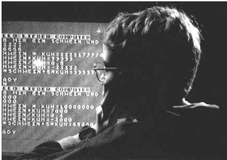
Los avances tecnológicos, incluida la llamada revolución informática, condicionan cada vez más la vida del hombre.

sa, pero incluye a los que trabajan de una manera más reglada o continuada en su casa (programadores, técnicos en imagen) o desde su casa (vendedores), e incluso a los que trabajan en centros de trabajo del tipo de las oficinas satélites. En caso de duda, una forma nueva de trabajo, en la que las telecomunicaciones son una parte fundamental del mismo, puede ser catalogada dentro de la modalidad del teletrabajo.