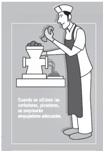
«Prevención de riesgos laborales en el sector de hostelería». Instituto Riojano de Salud Laboral

La Secretaría de Medio Ambiente y Salud Laboral del sindicato UGT dispone en su página web de la publicación: «Cuaderno preventivo: el ruido en el trabajo». El texto, de 54 páginas, se puede descargar en: www.ugt.cat «Salud laboral», «Documentos divulgativos», «Higiene Industrial».