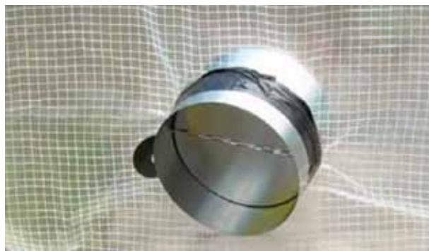
Figura 2. Compuerta anti-retorno

La compuerta anti-retorno de acero galvanizado (véase figura 2) permite la entrada de aire limpio al confina-