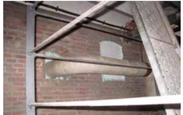
Figura 5. Identificación de posibles entradas de aire.

elementales a confinar es fundamental, para cumplir los cálculos teóricos, anular todas las posibles entradas de aire (figura 5) y en su caso, aislar y anular el servicio de los sistemas de ventilación y climatización. En función del riesgo potencial de los materiales con amianto existentes puede darse el caso que estos trabajos previos deban realizarse con riesgo de exposición al amianto, con todo lo que ello conlleva: equipo de descontaminación personal, equipos de protección respiratoria, etc.