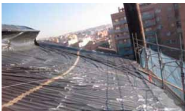
Figura 4. Trabajos previos al confinamiento

Los trabajos previos al montaje (figura 4) del confinamiento son clave para alcanzar un aislamiento del exterior lo más estanco posible. Una vez definidas las zonas