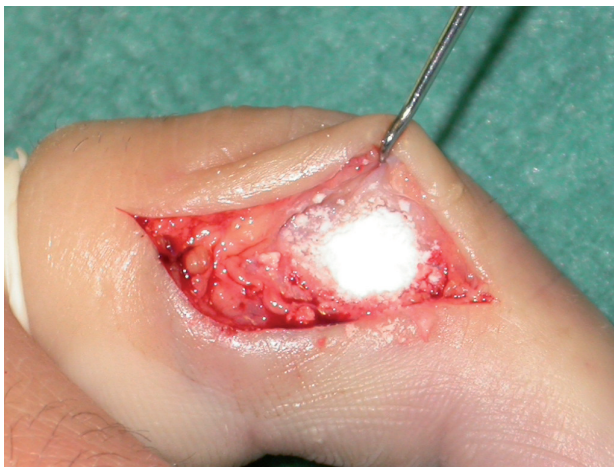
Fig. 2. Abordaje longitudinal del dedo, drenaje de la lesión, legrado de la cavidad, toma de muestras para cultivo/antibiograma, lavado con antisépticos y relleno de la cavidad con PerOssal® con vancomicina. Caso clínico 1.

2) y antibioterapia sistémica. La evolución resulta favorable con excelente movilidad del dedo. Se pasa desde los 6.6 mill/ \mu l a los 5.7 mill/ \mu l de leucocitos, con un 57% previo de neutrófilos, frente a un 53.2% posterior. La VSG disminuye desde los 6 a los 5 mm/h, al igual que la PCR, desde los 1.3 a los 0.5 mg/L, siendo el tiempo de tratamiento incluida la rehabilitación de 79 días y el agente el Staphylococcus aureus .