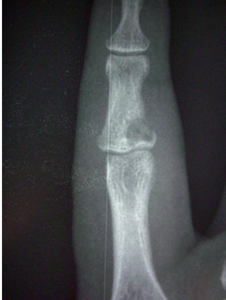
Fig. 1. Zona de osteomielitis en la base de la falange media del 5º dedo de la mano derecha. Caso clínico 1.