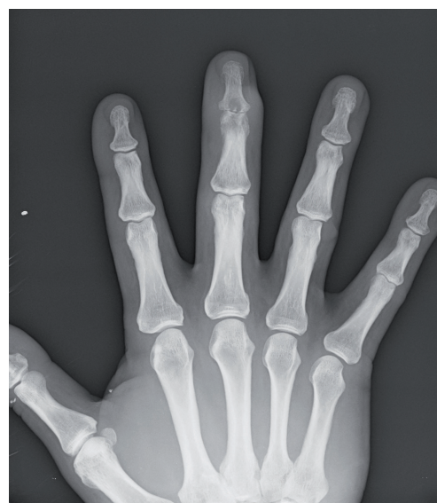
Fig. 3. Imagen de osteomielitis en la falange distal del 3º dedo de la mano derecha. Obliteración del espacio articular. Caso clínico 2.

El número de leucocitos desciende desde los 9.1 a los 7.6 mill/ \mu l, al igual que los neutrófilos desde el 54 al 50.1 %. La VSG tuvo, sin embargo, un valor final mayor desde 3 a 5 mm/h, al igual que la PCR (2.8 mg/L previos, frente a 4.8 mg/L al final del tratamiento). El tiempo de tratamiento incluyendo rehabilitación fue de 120 días, siendo el agente etiológico el Staphylococcus aureus . En ambos casos se procedió a la toma de muestras intraoperatorias para cultivo y antibiograma.