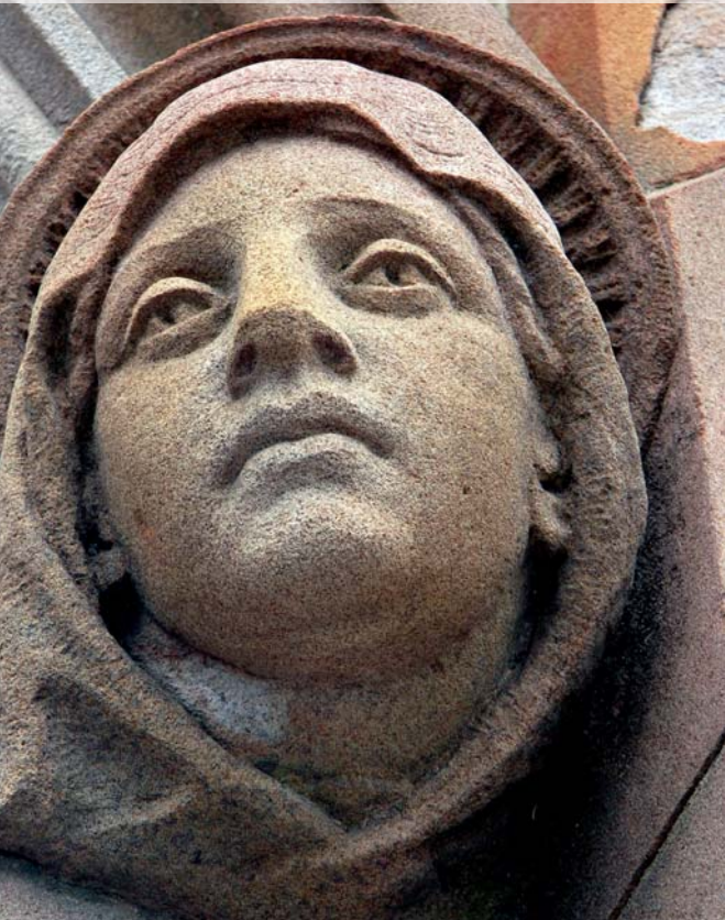
Figura tallada en la fachada de la Catedral de San Patricio, Melbourne

montaje y desmontaje de los escenarios y otras instalaciones en Sydney.