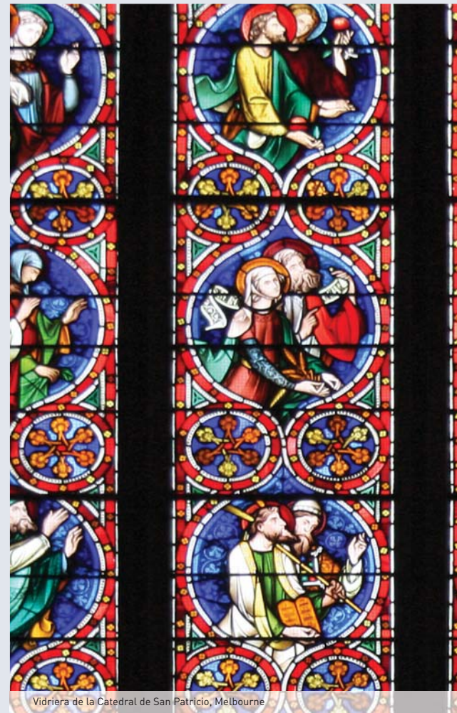
Vidriera de la Catedral de San Patricio, Melbourne

Las instalaciones de cada iglesia varían considerablemente y dependen de diversos factores, sobre todo la edad, el tamaño y la arquitectura. Según nuestra experiencia, las iglesias rara vez están equipadas con aire acondicionado o sistemas de rociadores automáticos contra incendios, pero la calefacción es habitual, principalmente mediante gas natural. Naturalmente, hay que recordar que nuestras iglesias no son "antiguas" según criterios europeos. Australia fue colonizada por europeos hace solo algo más de 200 años, así que una iglesia "antigua" en Australia se construyó hace sólo unos 150 años. Las alarmas tampoco son frecuentes en las iglesias australianas. No obstante, Catholic Church Insurances está financiando actualmente la instalación de modernos sistemas VESDA ( Very Early Smoke Detection Apparatus , aparatos de detección muy temprana de humo) en todas las catedrales y principales iglesias