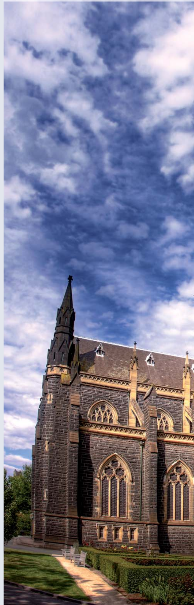
Catedral de San Patricio, Melbourne

El Vaticano no ofrece asistencia en este ámbito a nivel mundial. Por regla general, cada diócesis y cada congregación religiosa es indepen-