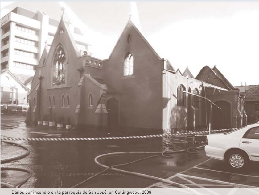
Daños por incendio en la parroquia de San José, en Collingwood, 2008