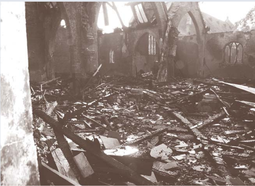
Daños por incendio en la parroquia de San José, en Collingwood, 2008