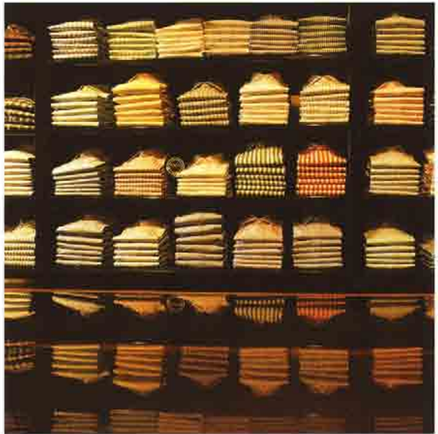
La antropometría también debe ser usada para la determinación de los tamaños de las tallas de una población en particular.

Los procedimientos tradicionales para realizar mediciones antropométricas se basan en determinar las alturas, profundidades y anchos de las diferentes partes del cuerpo humano a partir de puntos anatómicos estable-