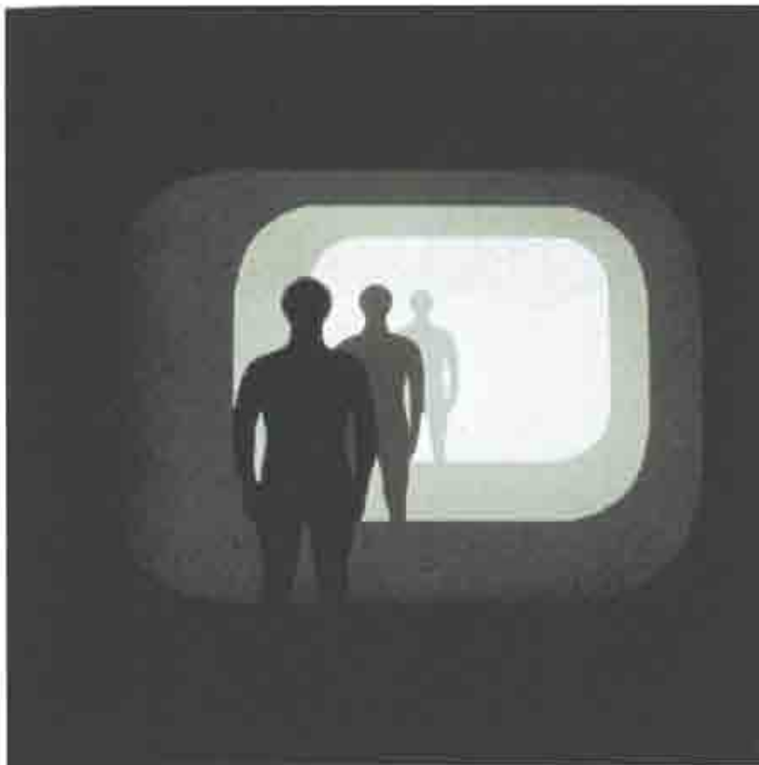
El uso del video y de la computadora como base de datos antropométricos permite obtener toda la información antropométrica necesaria para realizar múltiples diseños para una misma población.

y textos, requiere una gran capacidad de memoria computacional y cámaras de video de alta calidad. Estos medios no han sido explotados con estos fines, pero a partir de pruebas realizadas por este autor en sistemas compuestos por cámaras de video, computadoras, procesadoras dotados del software requerido, prueban su utilidad en este tipo de trabajo.