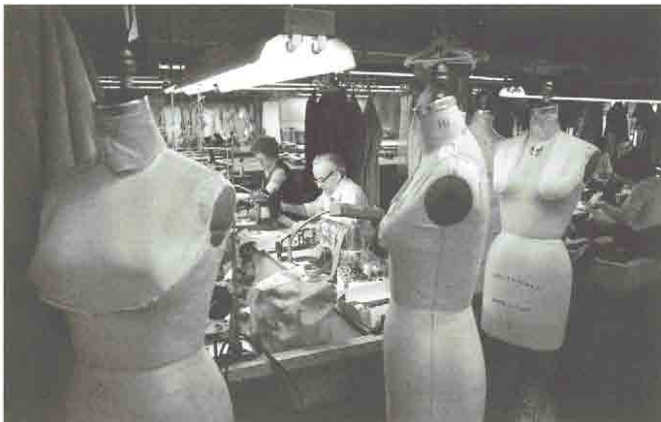
La norma cubana NC-40-64/84 establece los métodos de medición de las dimensiones del cuerpo humano para determinar el tamaño de las confecciones textiles.

radas con fines de diseño de manera general y contendrán gran cantidad de información, pero siempre se necesitará alguna otra que no esté contenida en ella.