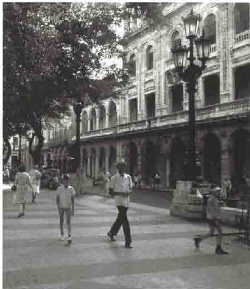
En Cuba no se han realizado estudios antropométricos que permitan conocer las características de la población.

C. N. Ong, et al. , 1988 (21), hace un estudio sobre las preferencias posturales de los operadores de video ter-