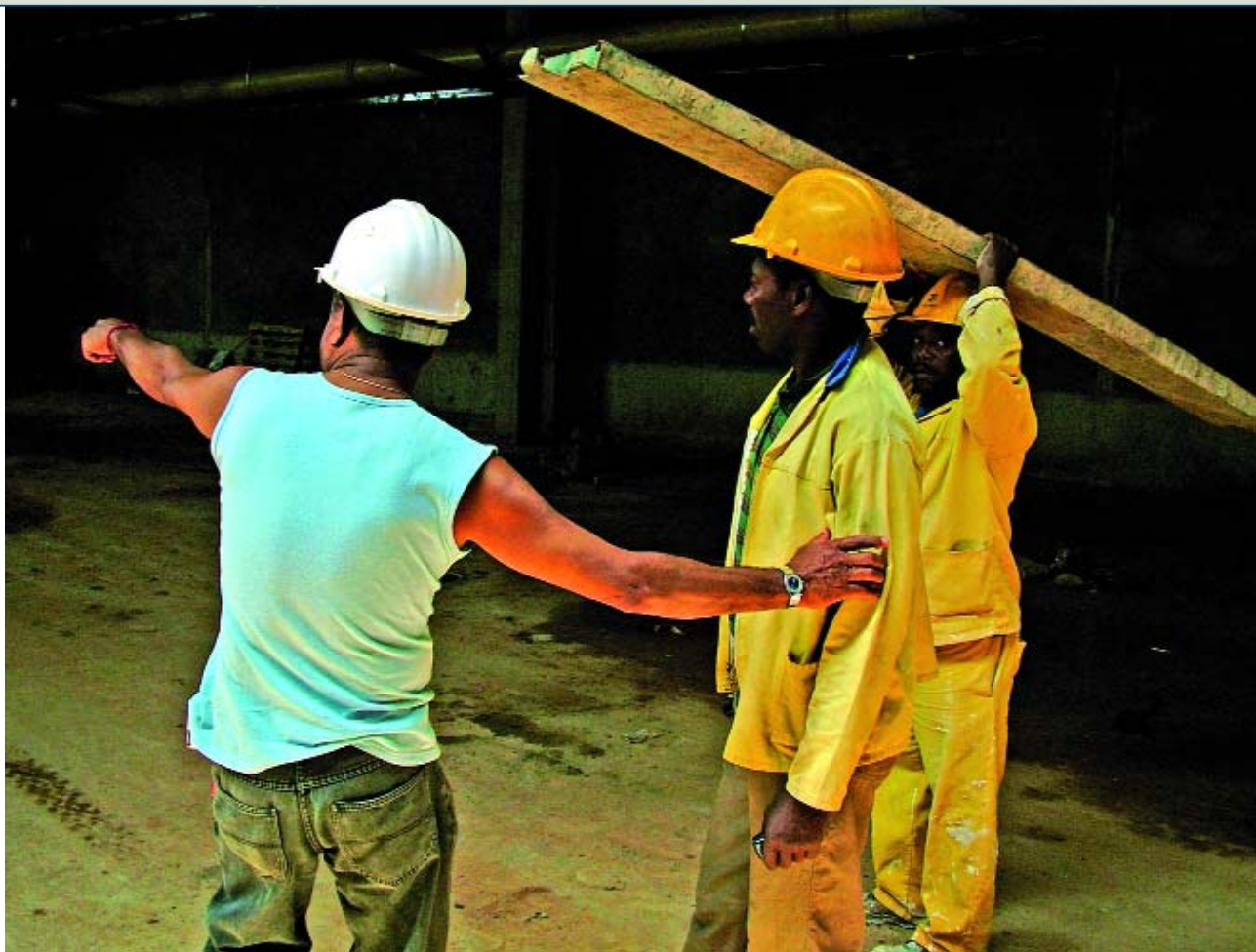
La Ley de Prevención no ha previsto la incorporación masiva de inmigrantes en el mercado laboral español.

tivo en materia laboral, salvo los temas concretos del reglamento de extranjería. El marco normativo incluye y protege a los inmigrantes tanto como a los españoles siempre que se encuentren en situación legal.