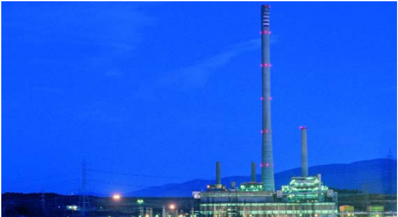
Las grandes empresas pueden corregir deficiencias en la aplicación de la Ley aprovechando los errores de las pymes, dotadas de menos medios.

El prestigio de que goza la empresa Michelin en materia de seguridad está ganado a pulso. De entrada, los mandos de la multinacional están comprometidos en la dinámica denominada «Resultado