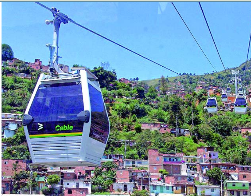
Metro de Medellín (en la foto, el metro cable) aplica el principio de seguridad integral.

y responsabilidad». En función de la misma, la seguridad de los empleados es primordial: «Para avanzar en este terreno, cada miembro de la empresa debe convertirse en un actor responsable». Todo ello implica una decidida apuesta por la formación de las personas.