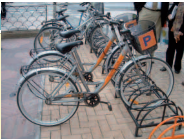
El servicio municipal de préstamo de bicicletas está teniendo una gran acogida en Vitoria.

se habilitan nuevos canales y formas de movilidad y, además, se fomentan hábitos de transporte que contribuyen al ahorro energético y a la lucha contra el cambio climático. Las cifras certifican la buena acogida de esta propuesta: en 2004 se registraron 25.000 usos; en 2005 fueron 50.000, y en 2006, hasta el mes de junio, ya ascendían a 30.000. Hay que destacar que la mayoría de los préstamos fueron realizados a habitantes de la propia ciudad de Vitoria, lo cual demuestra que la sostenibilidad de una idea se inserta en la idiosincrasia de sus ciudadanos.