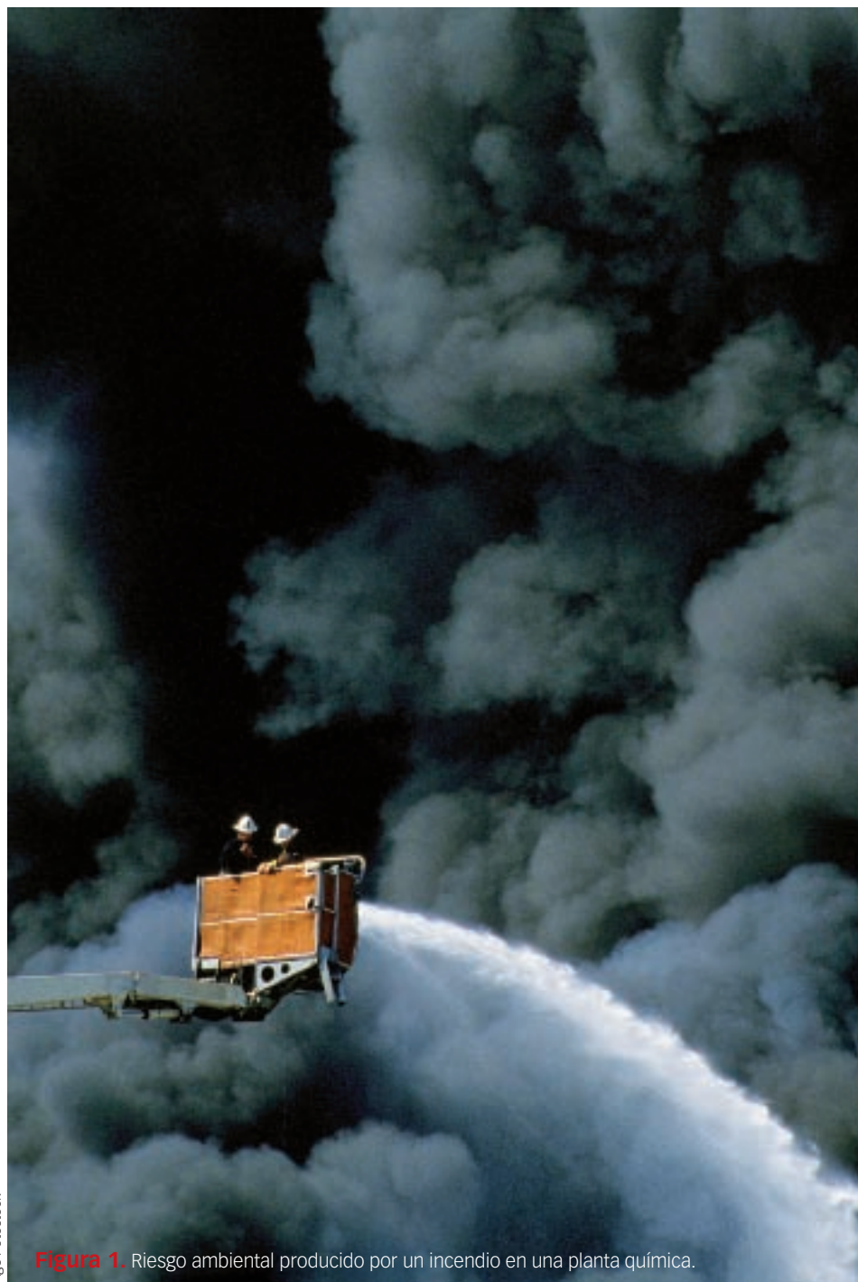
Figura 1 Riesgo ambiental producido por un incendio en una planta química.

Una vez ocurrido el siniestro, no toda la cantidad involucrada va a ser transportada hasta alcanzar los receptores vulnerables, pero este factor da una idea de la magnitud del accidente