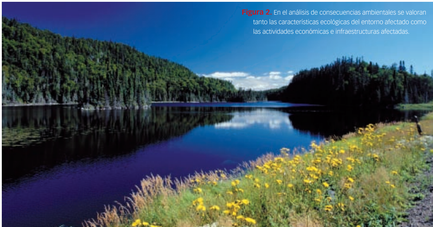
Figura 2. En el análisis de consecuencias ambientales se valoran tanto las características ecológicas del entorno afectado como las actividades económicas e infraestructuras afectadas.

Este tipo de información se puede obtener realizando una consulta a la administración competente (Consejería de Medio Ambiente de la comunidad autónoma correspondiente o, en su defecto, a la Dirección General para la Conservación de la Naturaleza, dependiente del Ministerio de Medio Ambiente) acerca de la flora y fauna bajo alguna de las figuras de protección existentes dentro del área de influencia del escenario accidental objeto de estudio. Además, dicha información también se encuentra en algunos casos en la web del Ministerio de Medio Ambiente, en el apartado «Inventario Nacional de Espacios Naturales Protegidos» [8].