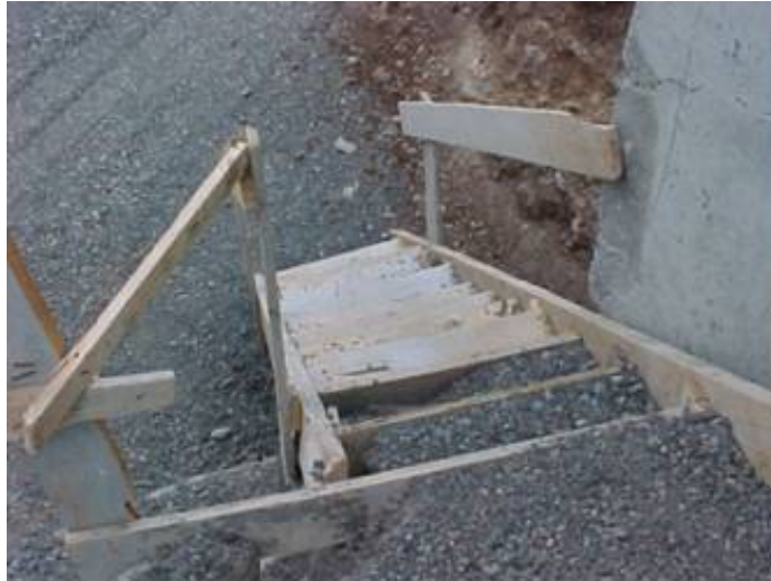
Las vías de acceso a los equipos de trabajo y que formen parte de éstos deben cumplir las condiciones generales exigidas.