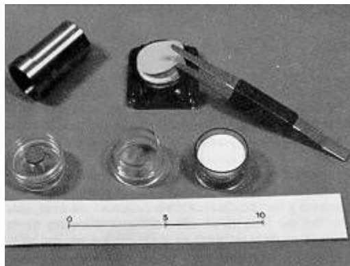
Fig. 2: Componentes de la unidad de captación