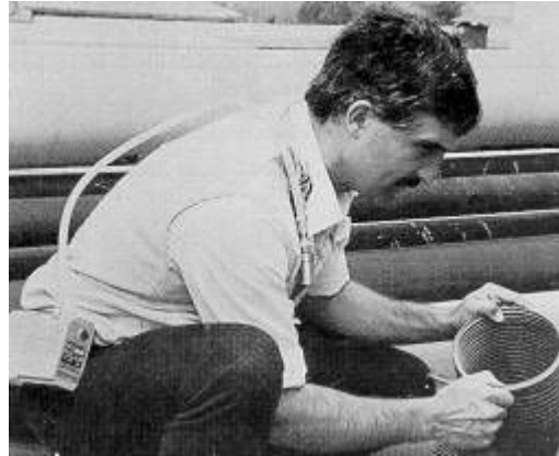
Fig. 3: Toma de muestras de amianto

El extremo del tubo se conecta con ayuda de un adaptador a la unidad de captación, constituida por el portafiltros o cassette sin tapa (cuerpo superior retirado) y adaptado a una caperuza o protector. El conjunto se orienta hacia abajo para la captación, tal como se muestra en la Figura 3.