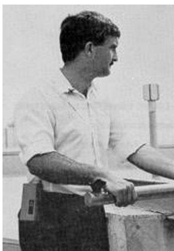
Fig. 2: Toma de muestra con tubo adsorbente

A continuación se toma el tubo absorbente preparado al efecto y se rompen sus extremos de modo que queden unos orificios no inferiores a la mitad del diámetro interior del tubo.