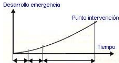
Fig. 1: Tiempo de intervención en emergencias

Como ya se ha mencionado anteriormente, en caso de emergencia se realizan toda una serie de acciones para limitar sus consecuencias: Evacuar, intentar la extinción con medios propios, avisar a bomberos, etc. Una de las claves en el éxito de dichas acciones es tener presente que cualquier acción que vaya a tomar, implica un tiempo de retardo, durante el cual la emergencia se ha desarrollado y su control se hace cada vez más difícil, tal como se indica en la figura 1.