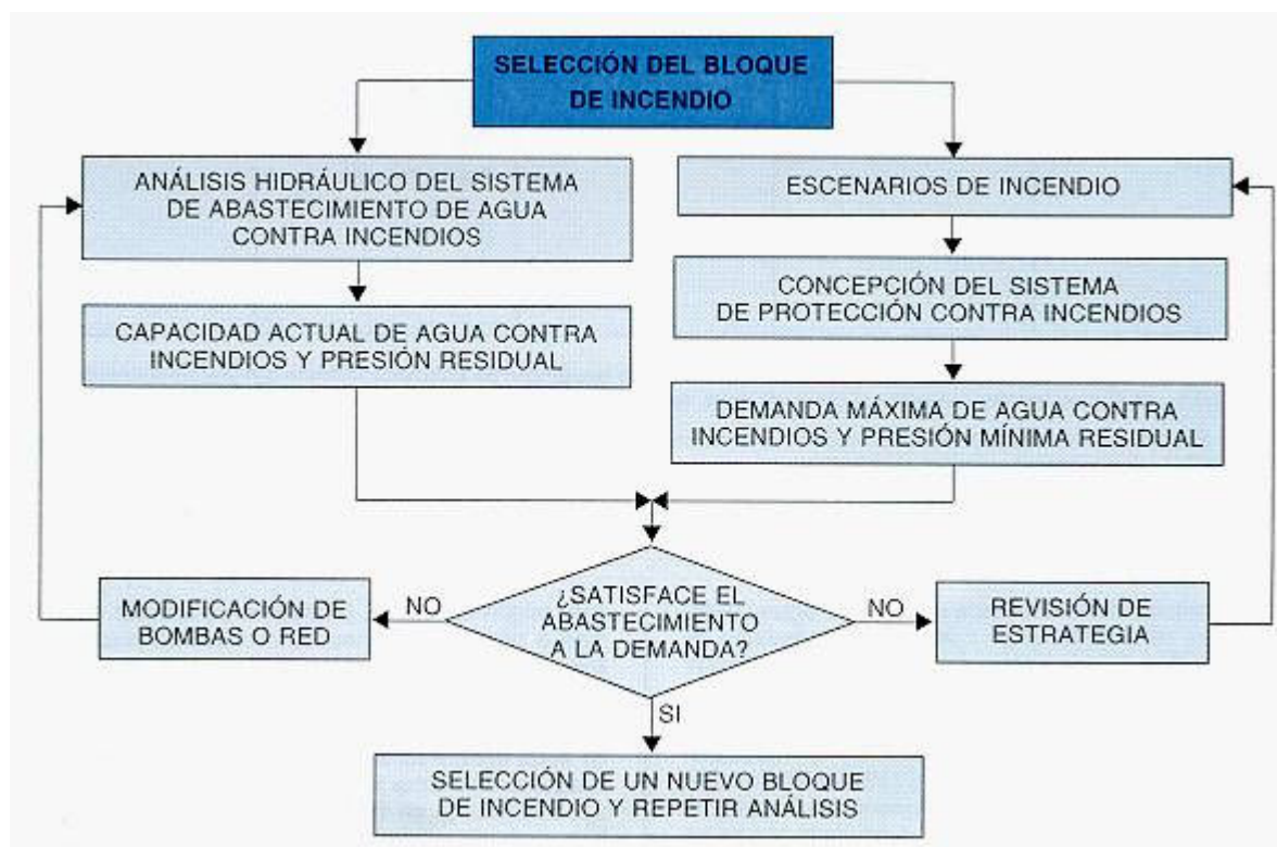
Fig. 3: Esquema orientativo para evaluación de abastecimiento de agua contra incendios y sistema de distribución basado en el análisis del riesgo de incendio

El sistema de actuación para plantas existentes puede ser el representado en la Figura 3.