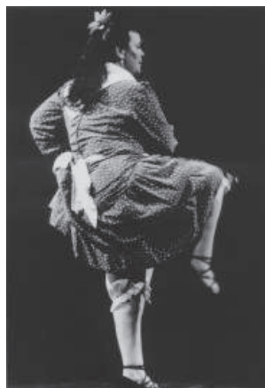
Figura 1. Juana la del revuelto

Dado que en este campo de trabajo, como se ha dicho anteriormente, no existe experimentación previa y estu-