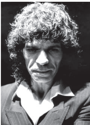
Figura 5. Camarón

sores (carga mental negativa que pueda sufrir el artista) y amortiguadores (factores que compensan los aspectos negativos o que refuerzan los positivos) es el que determina que la interpretación resulte reconfortante, equilibrada o rentable desde el punto de vista anímico, y, en consecuencia, positiva desde otros puntos de vista (como por ejemplo el técnico), que en su conjunto determinan el nivel final de la interpretación.