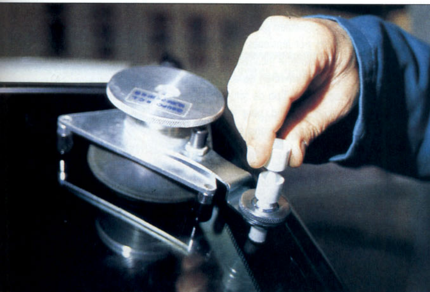
Inyección de la reparación

A continuación se describe, en líneas generales, el proceso de reparación de estalladuras por impacto.