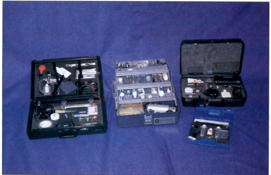
Distintos equipos para la reparación de parabrisas

- Inyector: es un sistema de pistón, que es el encargado de inyectar a presión la resina al interior de la estalladura. Dispone en su parte inferior de una goma de estan-