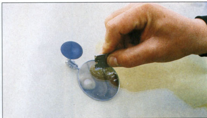
Raspado de la resina

• La reparación comienza con el lavado de la luna, tapando el impacto con una cinta adhesiva o procurando que no entre agua ni productos químicos en el impacto.