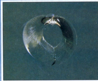
Ojo de buey