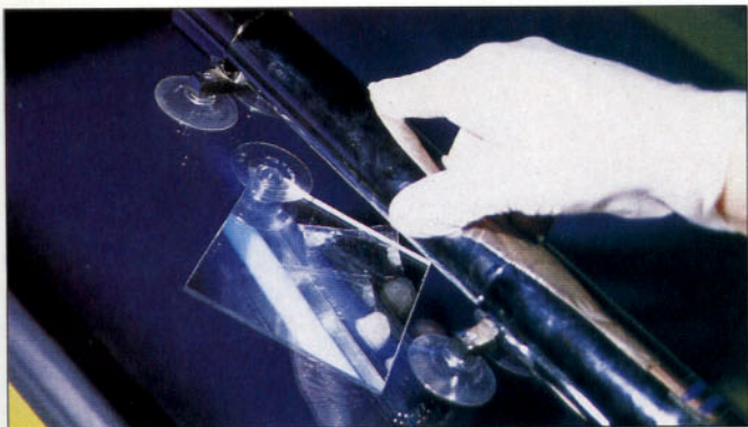
Secado de la resina con lámpara UV