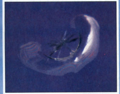
Ojo de buey parcial