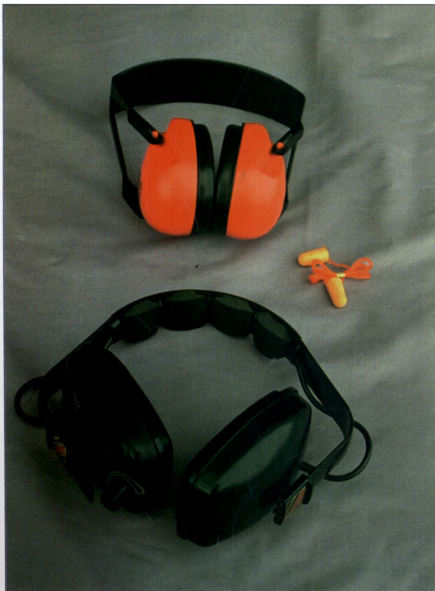
Diferentes protecciones auditivas

raciones de corte y desgrapado de la chapa o incluso el batido de la misma y siempre que la herramienta o el proceso utilizado aumente el nivel de ruido por encima de esos valores.