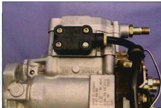
Regulador de caudal de inyección.