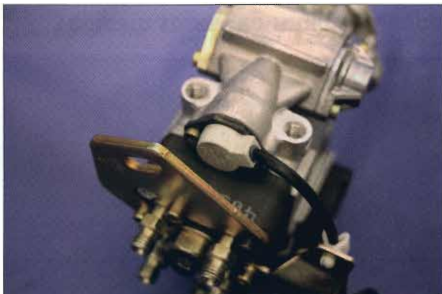
Válvula de regulación de avance.

En el cuadro adjunto se muestran algunos ejemplos de programas de emergencia.