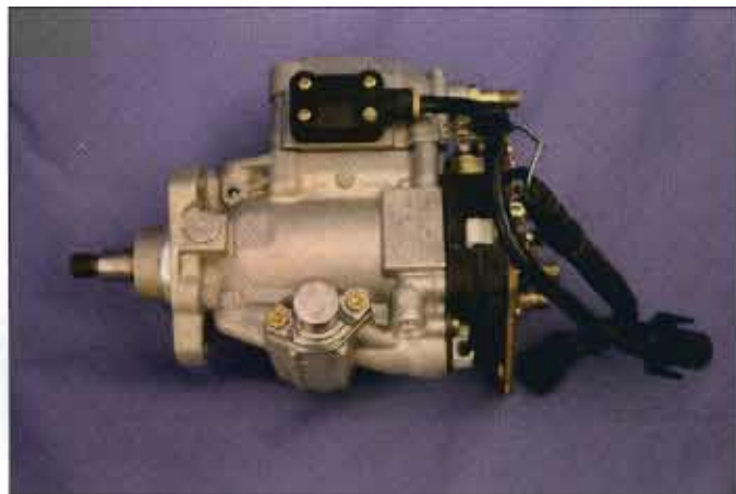
Bomba de inyección.

• Mecanismo de regulación del momento de inyección. En la bomba inyectora se ha situado una válvula electromagnética, comandada por la unidad de control, que regula la presión que actúa so-