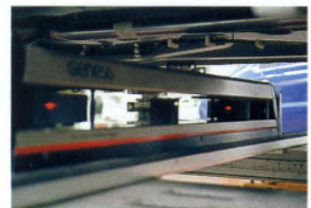
En el centro: Control de un punto de la carrocería.