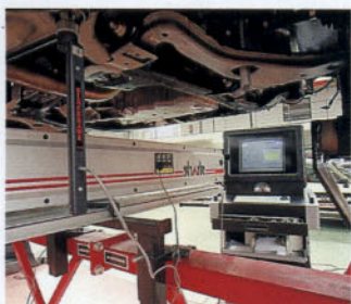
Selección de los puntos cero de centrado

Estos equipos también pueden ser utilizados fuera de la bancada