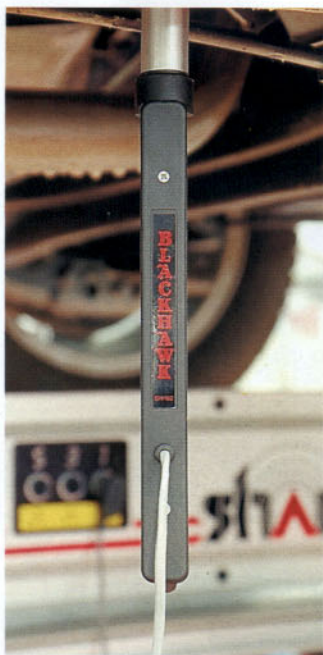
Sistema de medición electrónica por ultrasonidos. A la derecha, medición de puntos