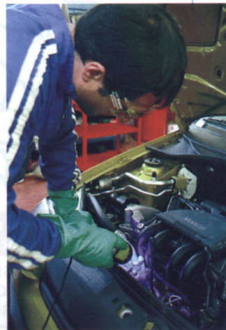
Localización de fugas en el sistema