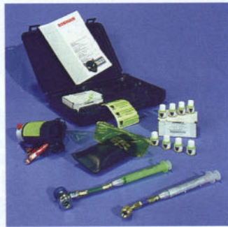
Componentes del equipo

El fabricante suministra con el equipo el reflector, así como el filtro, las juntas tóricas, los inyectores, las gafas de seguridad y los tintes para la verificación de los diferentes sistemas, tales como el líquido refrigerante, aceite del motor, fluidos de transmisión o combustible.