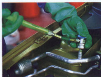
Colocación y detalle de los inyectores