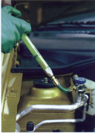
Inyección del tinte y colocación de la pegatina