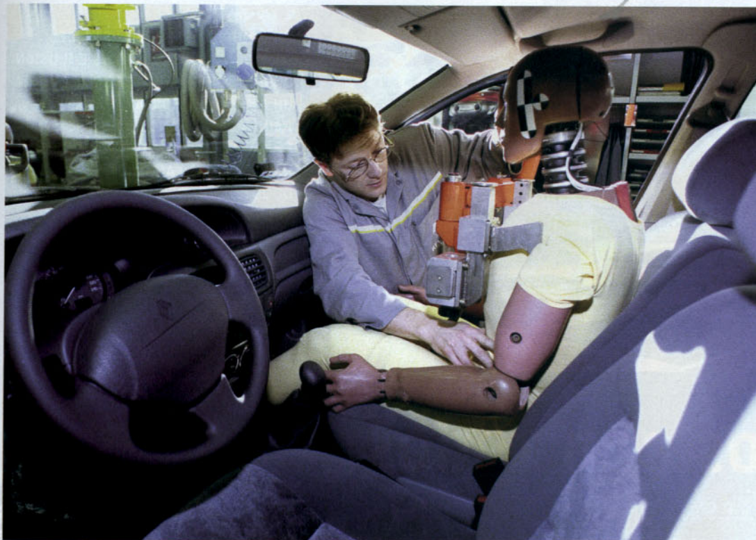
Dumie para un ensayo de seguridad

Además, el sistema está pensado tanto para las sillas que se deben colocar en sentido contrario a la marcha del vehículo, más adecuadas para niños de hasta 15 kgs, como para aquellas que se colocan en el sentido de la marcha, generalmente para niños de mayor talla y peso.