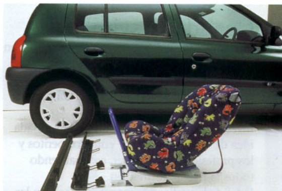
Sistema Isofix desmontado

Los airbag frontales serán aún más inteligentes. Estarán equipados con detectores de peso y de posición del asiento para realizar el disparo del airbag