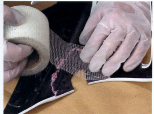
Colocación de malla de refuerzo