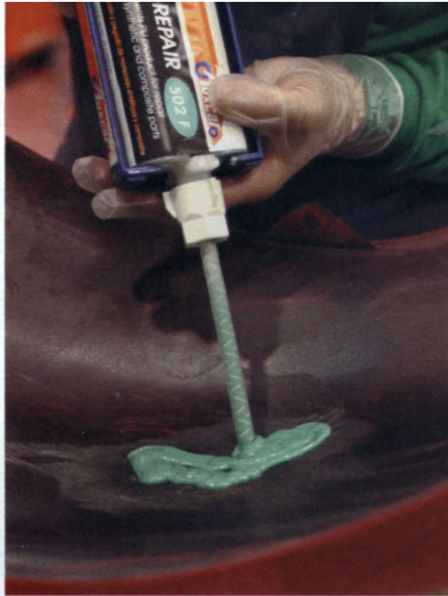
Aplicación del adhesivo