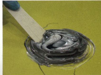
Mezclado manual del adhesivo