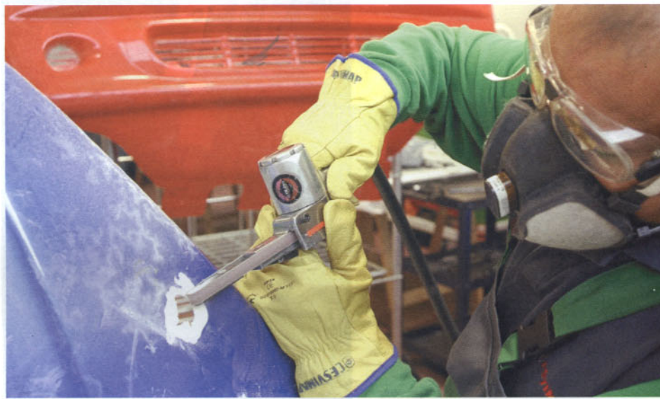
Lijado y achaflanado

con una llama oxidante, como la de un soplete de fontanero, con las debidas precauciones para no deformar la pieza.