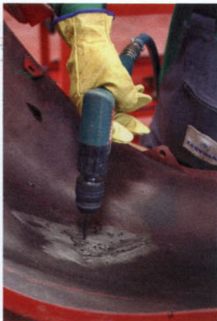
Taladro del perímetro de la rotura

↓ independiente. Las propiedades finales del producto, así como el tiempo de secado, dependen del catalizador, pudiendo variar su proporción de un 25% a un 50%. El curado se realiza a temperatura ambiente; el proceso puede acelerarse mediante la aplicación de calor.