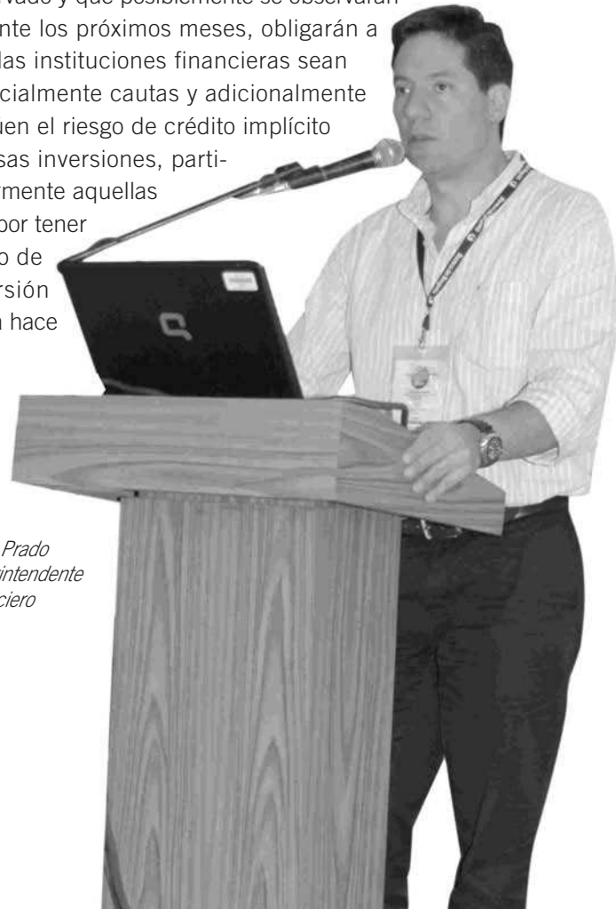
Cesar Prado Superintendente Financiero

Sobre los riesgos financieros el Superintendente se refirió a los riesgos de mercado y crédito. Aunque la norma que establece el margen de solvencia para las compañías de seguros no considera este riesgo, el supervisor propuso a la industria que se defina una hoja de ruta para la implementación de solvencia II, incorporando inicialmente requerimientos de capital por riesgo de mercado en dichas formulas. Es evidente que las volatilidades que se han observado y que posiblemente se observarán durante los próximos meses, obligarán a que las instituciones financieras sean especialmente cautas y adicionalmente evalúen el riesgo de crédito implícito en esas inversiones, particularmente aquellas que por tener grado de inversión hasta hace