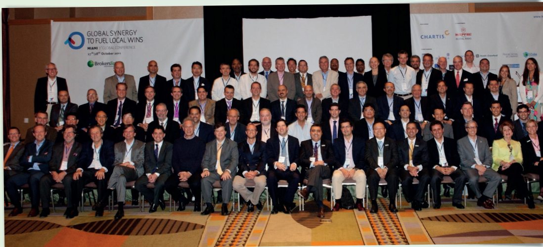
BrokersLink Third Global Conference (Oct'11)

One year, 365 days... a lot can happen... and a lot did happen for BrokersLink. What a year! Many events were organized, new members were admitted and our market awareness, reputation and recognition increased in an exponential way. What else could be expected? A lot more! 2012 will certainly surpass this excellent year!