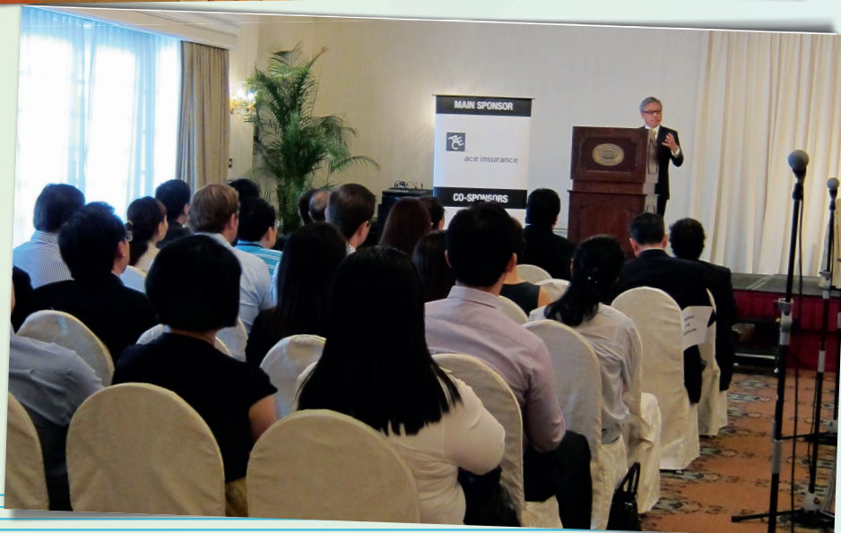
BrokersLink Asia Pacific Conference (Feb'11)