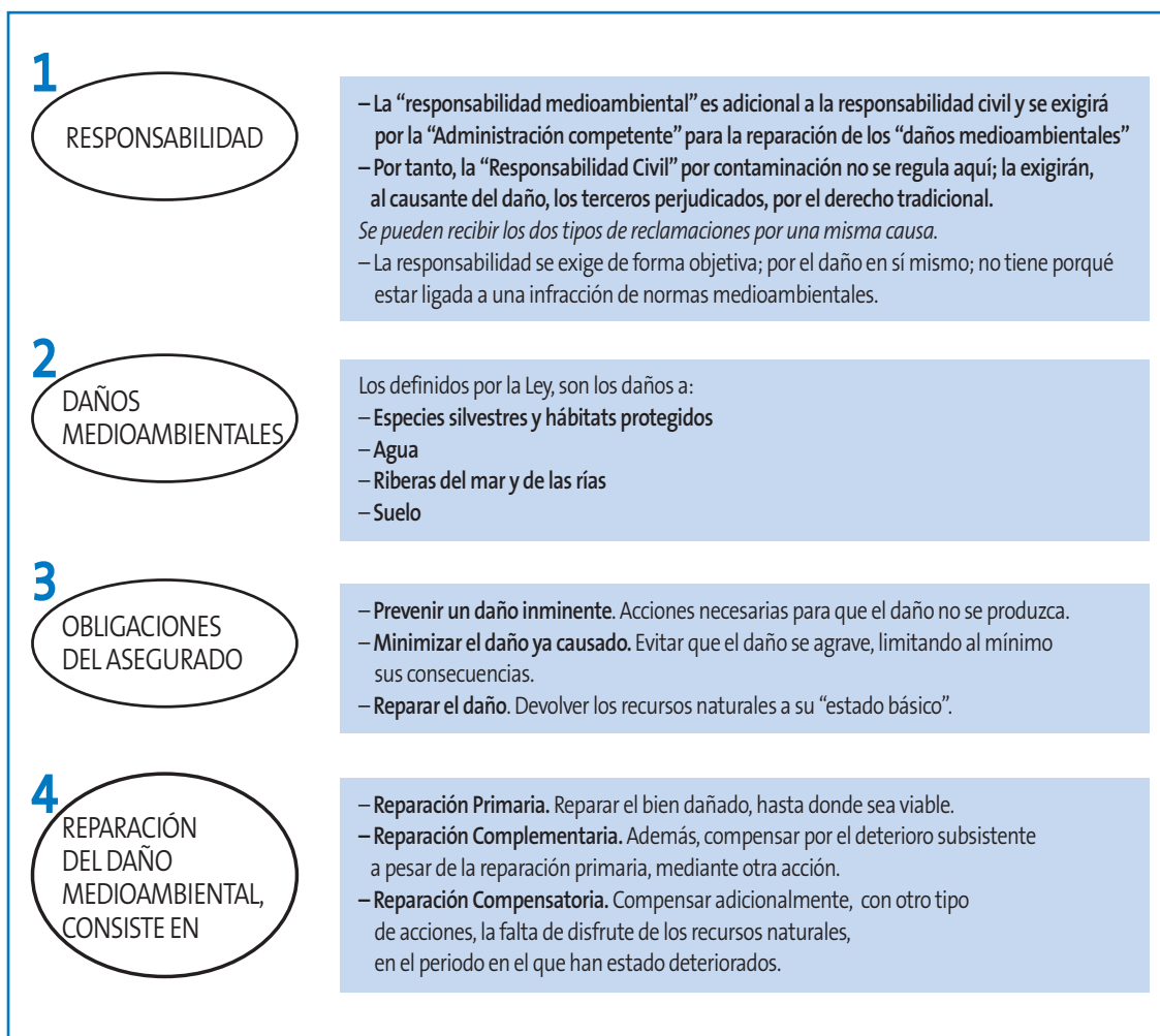
FIGURA 2. Peculiaridades del Regimen de Responsabilidad Medioambiental

La legislación medioambiental y su aplicación. - Hay que aclarar que cuando hablamos de riesgo ambiental estamos refiriéndonos a las responsabilidades que se pueden exigir a nuestro asegurado por causar un daño medioambiental con su actividad; en consecuencia, uno de los factores principales es la legislación que marca el alcance de dichas responsabilidades: una legislación