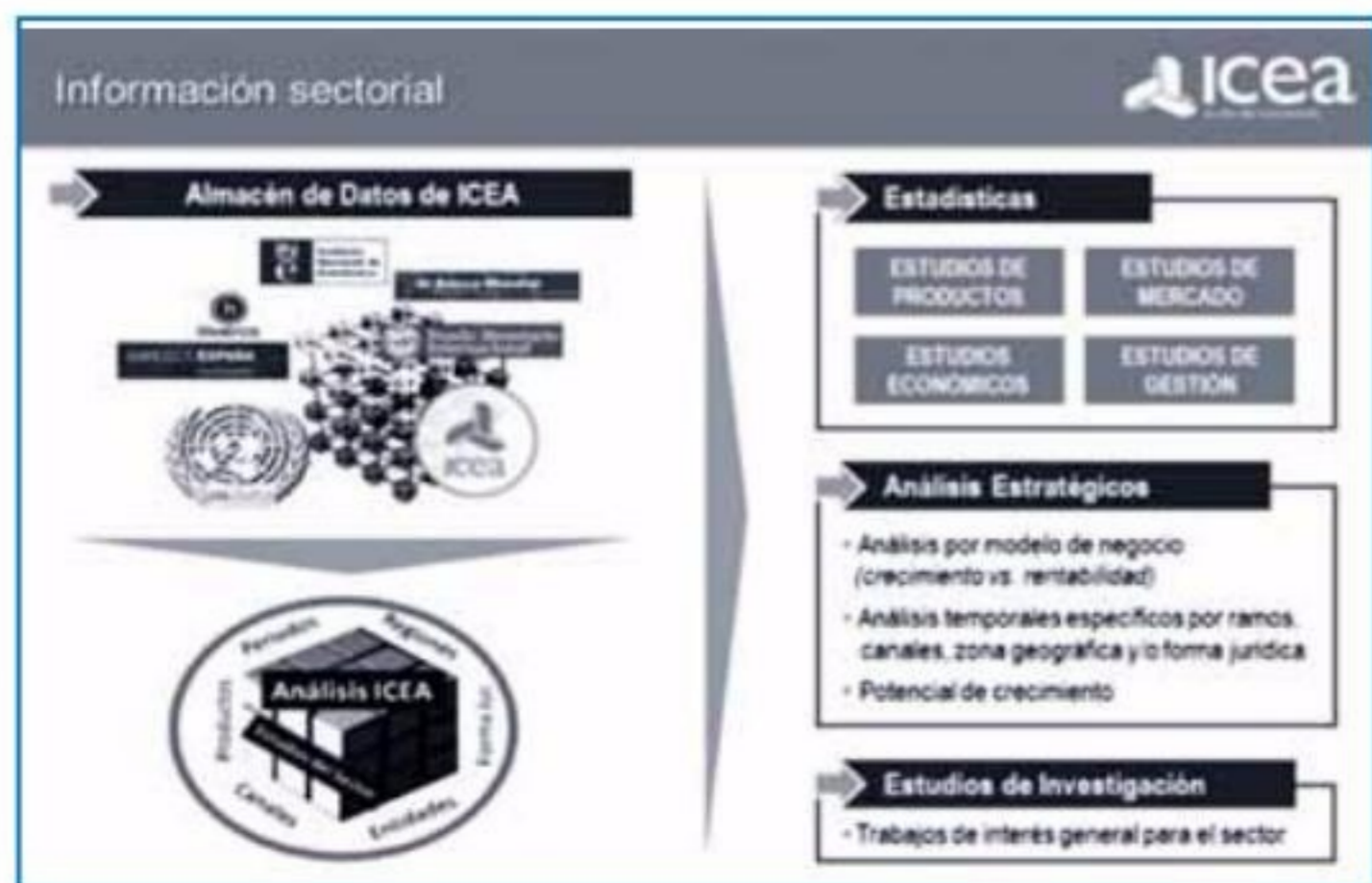
FIGURA 1. Productos y servicios proporcionados por ICEA