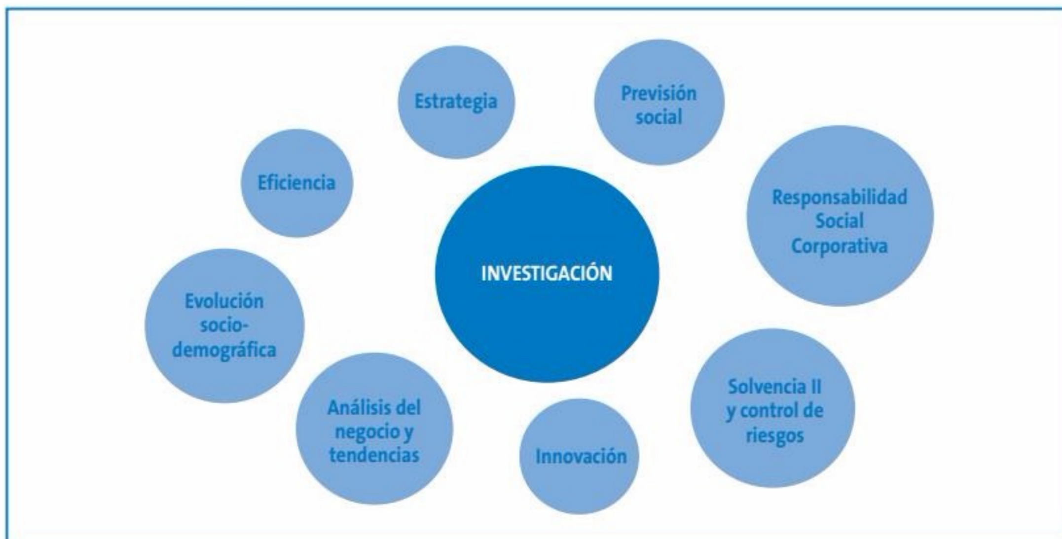
FIGURA 4. Estudios de investigación

El alto nivel de participación de las entidades en las diferentes estadísticas, por encima del 90% y en ocasiones del 95%, garantiza la fiabilidad de los resultados obtenidos