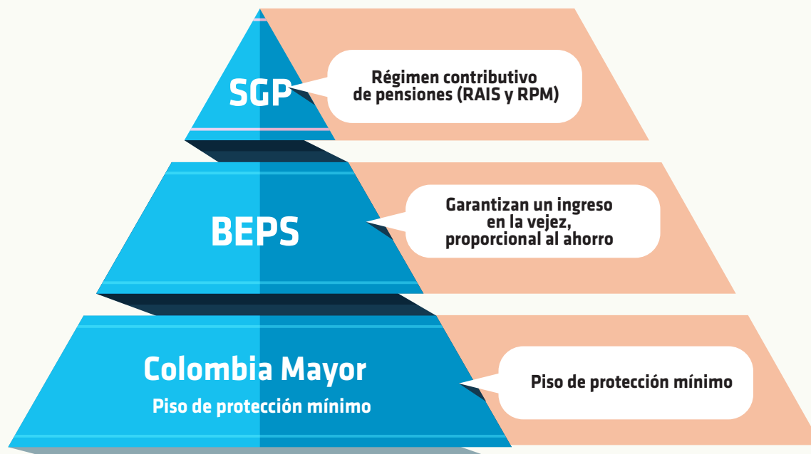
Gráfico 3: Nuevo modelo de protección para la vejez