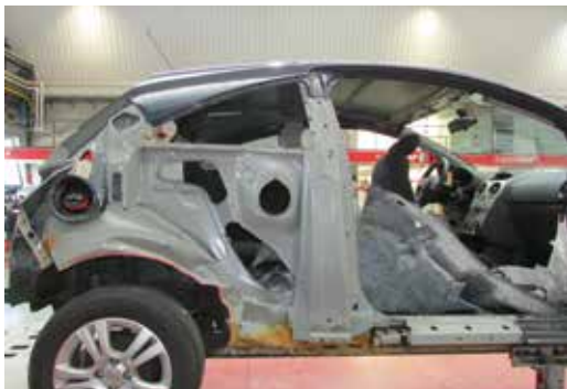
► Costado de carrocería con refuerzo de pilar B, y sin él

LA COMBINACIÓN DE PIEZAS DE ULTRAALTO LÍMITE ELÁSTICO Y DE ACERO CONVENCIONAL CAMBIA RADICALMENTE LA FORMA DE GENERARSE LAS DEFORMACIONES