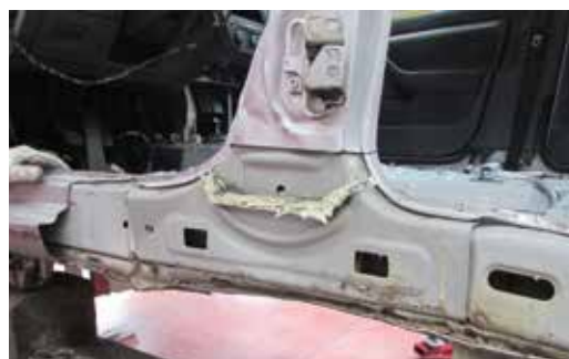
► Exterior e interior de la zona de unión entre pilar B y estribo