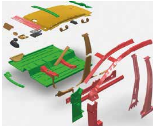
► Traviesas de piso de habitáculo

También hay que tener en cuenta la presencia de traviesas del piso del habitáculo de acero de ultraalto límite elástico; por su rigidez, tienden a transmitir los esfuerzos del impacto, descuadrando el túnel del habitáculo, lo que supondría operaciones de estiraje.