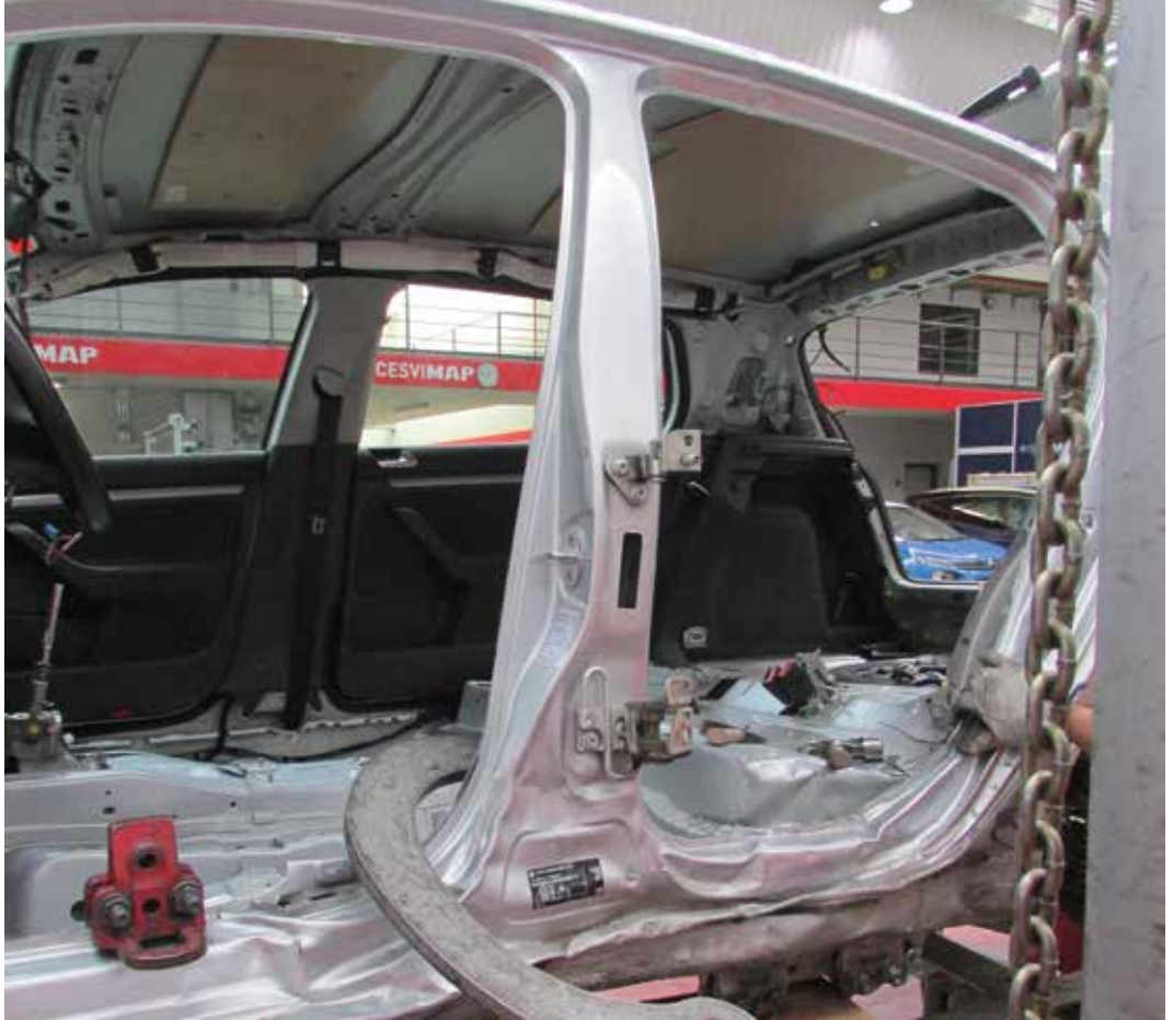
► Estiraje en bancada del pilar B