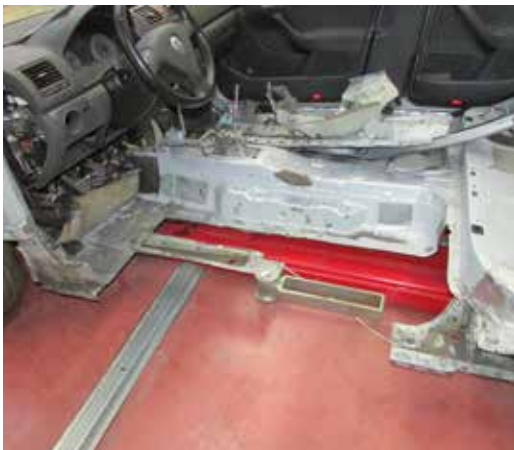
► Sustitución del piso de habitáculo en sección parcial