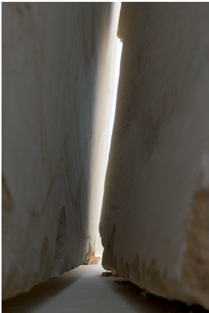
Brecha #01, 2024.

Su producción artística se caracteriza por una meticulosa organización en series, que construyen un mosaico fluido de significados. Esta serialidad, en los polípticos de Guerrero, no se asocia tanto a la repetición, sino a la celebración de la diferencia, construyendo así un paisaje que actúa como un personaje, tanto interviniente como intervenido.