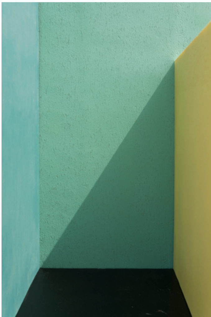
BRG-067, 2022.