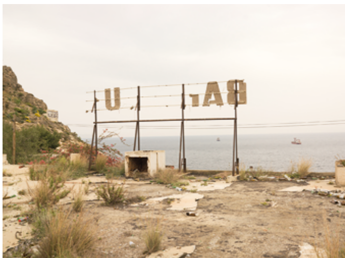
Castell del Rey, Almería, 2007. Colección Museo Centro de Arte Dos de Mayo

Fundación MAPFRE presenta la primera gran exposición monográfica del artista granadino José Guerrero (Granada, 1979) que desde hace veinte años explora la relación entre el paisaje natural, arquitectónico y arqueológico con la actividad humana y el paso del tiempo. En el conjunto de su obra, José Guerrero concibe el paisaje como una entidad activa y dinámica, donde lo sociopolítico, lo cultural y el imaginario colectivo se entrelazan de manera intrigante. La estratificación del tiempo y de la memoria, junto con los signos visibles del cruce y superposición de diversas culturas, son temas recurrentes en la obra de este artista.