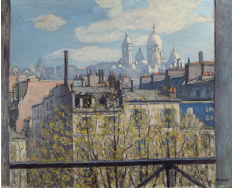
Albert André Montmartre, vue du boulevard de Clichy [Montmartre, vista del bulevar de Clichy], c. 1921 Óleo sobre lienzo Colección particular

mostrar la obra de estos artistas, menos afamados que algunos de sus contemporáneos. Esto puede deberse a que el propio Durand-Ruel no vivió lo suficiente como para asegurar su éxito (moriría en 1922), así como porque por aquellas fechas las vanguardias históricas se encontraban en plena efervescencia y el trabajo de estos cinco pintores podía parecer menos innovador.