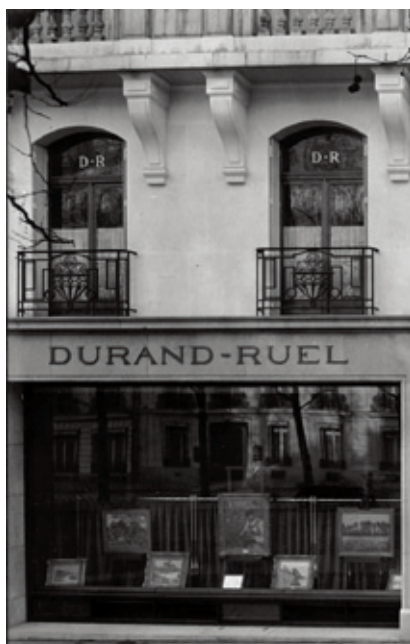
Fachada de la galería Durand-Ruel en rue de Rome, n.º 37, París (detalle).