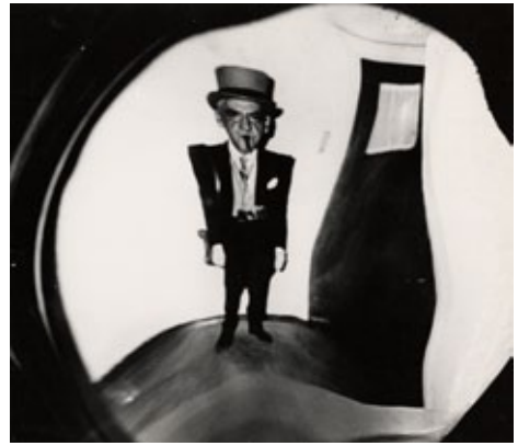
Charlie Chaplin, distorsión, ca. 1950.