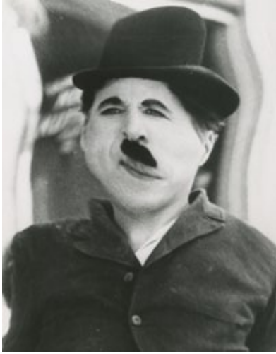
Autorretrato, ca. 1963.