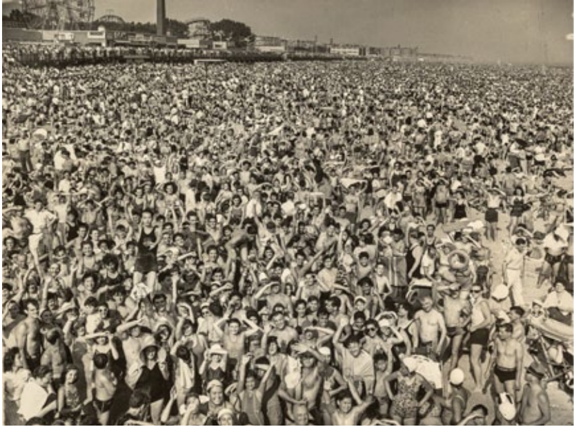
Gentío en Coney Island por la tarde, 21 de julio de 1940.