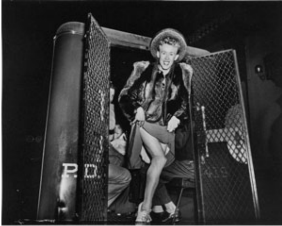
Hombre detenido por travestismo, Nueva York, ca. 1939.