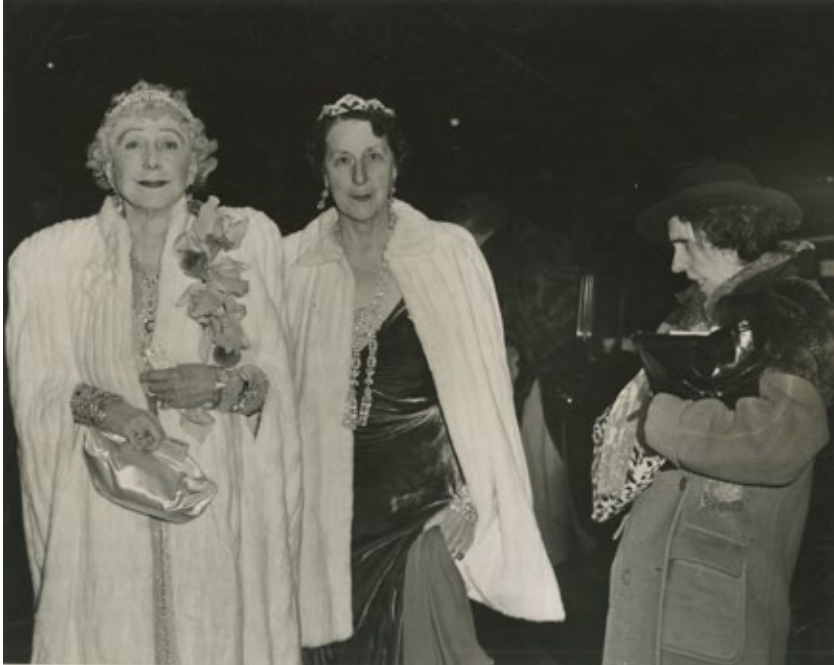
La crítica , Nueva York, 22 de noviembre de 1943.

Situacionista Guy Debord en el que hace un incisivo retrato de la sociedad contemporánea, que habría sido sustituida por su imagen representada. A lo largo de su escrito, Debord revela de forma crítica la teoría y la práctica del espectáculo, dando cuenta del modo en que este regula nuestra experiencia del tiempo, de la historia, de la mercancía, del territorio y de la felicidad. En el siglo XXI, donde la inmediatez prevalece, las ideas de Debord resuenan como el análisis más lúcido y severo de las miserias y servidumbres de una sociedad la del espectáculo en la que vivimos todos.