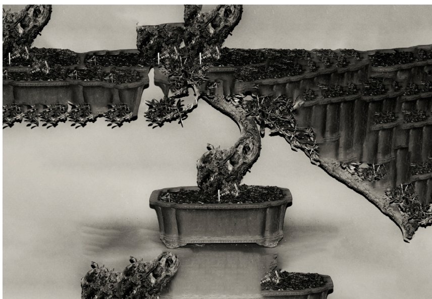
Ivette Blaya, Simplemente cortando , 2022 © Ivette Blaya