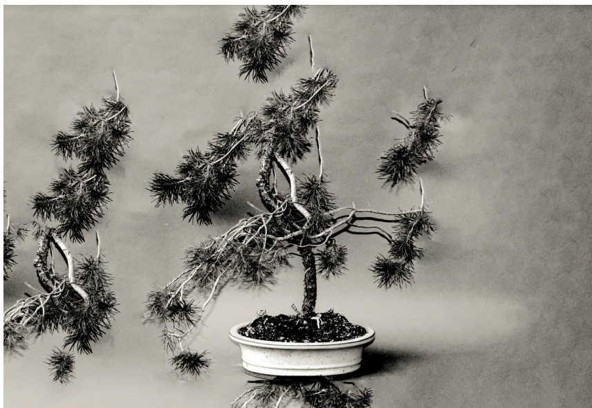
Ivette Blaya, Simplemente cortando , 2022 © Ivette Blaya