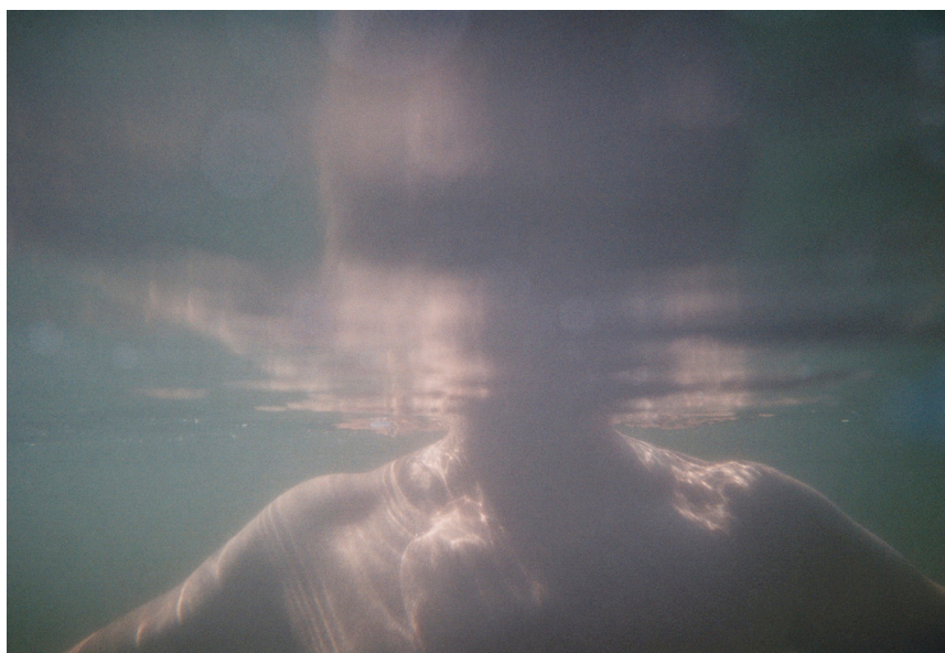
Alan Balzac, La muerte de la identidad , 2021