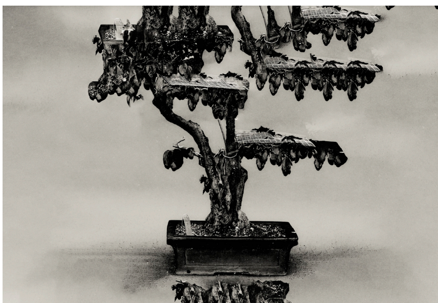
Ivette Blaya, Simplemente cortando , 2022