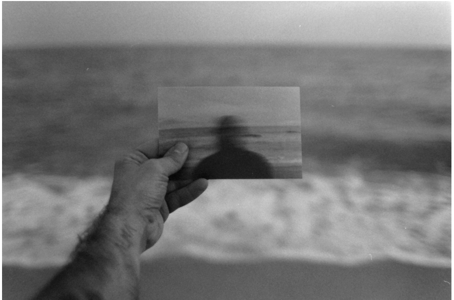
Alan Balzac, La muerte de la identidad , 2021 © Alan Balzac

«Trobar-se amb un mateix en la imatge. M'hi reconec perquè m'hi he vist, perquè els meus ulls es troben amb els seus ulls, els meus, que són els seus; un altre jo amb qui dialogo en el temps. Qui soc? Li ho demano i m'ho demano.»