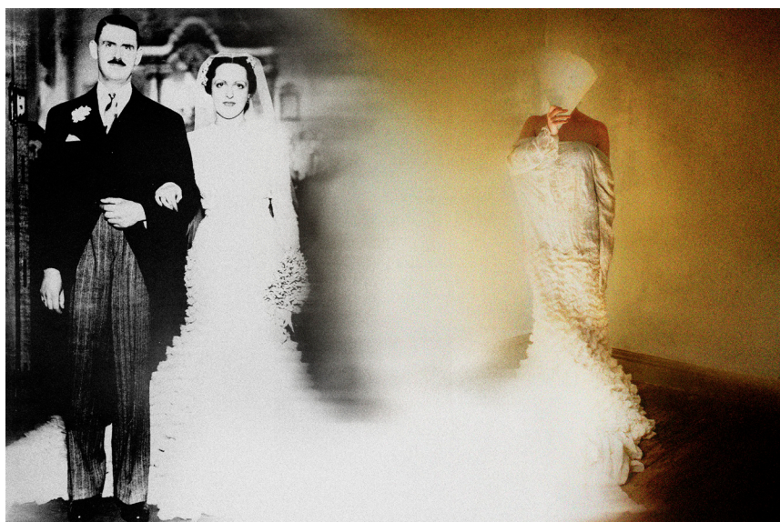
Lucía Morón, Te amo. Yo tampoco. , 2021 © Lucía Morón