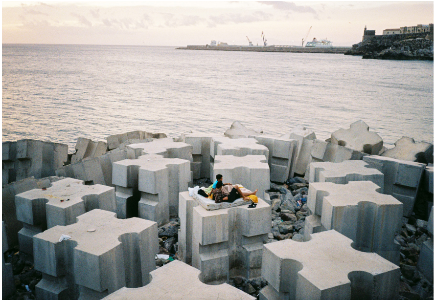
Rocío Madrid, Melilla , 2021

Melilla és una ciutat fronterera del nord d'Àfrica, on l'autora va créixer i on viu actualment. Com a parapet per a l'allau de migrants en trànsit cap a Europa, és un espai físic ple de contradiccions que s'erigeixen en proves d'una idiosincràsia molt particular marcada per la història, el contrast cultural i la convivència dins d'un context que no hauria de tenir cabuda en un món cada vegada més globalitzat.