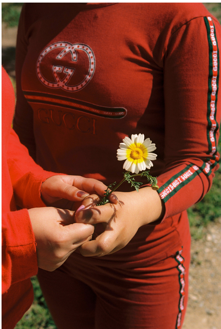
Rocío Madrid, Melilla , 2021