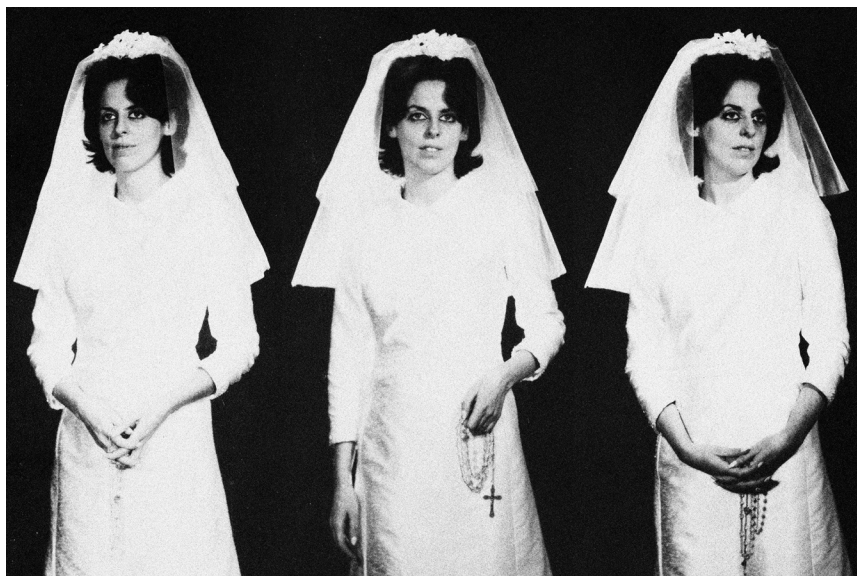
Lucía Morón, Te amo. Yo tampoco. , 2021 © Lucía Morón