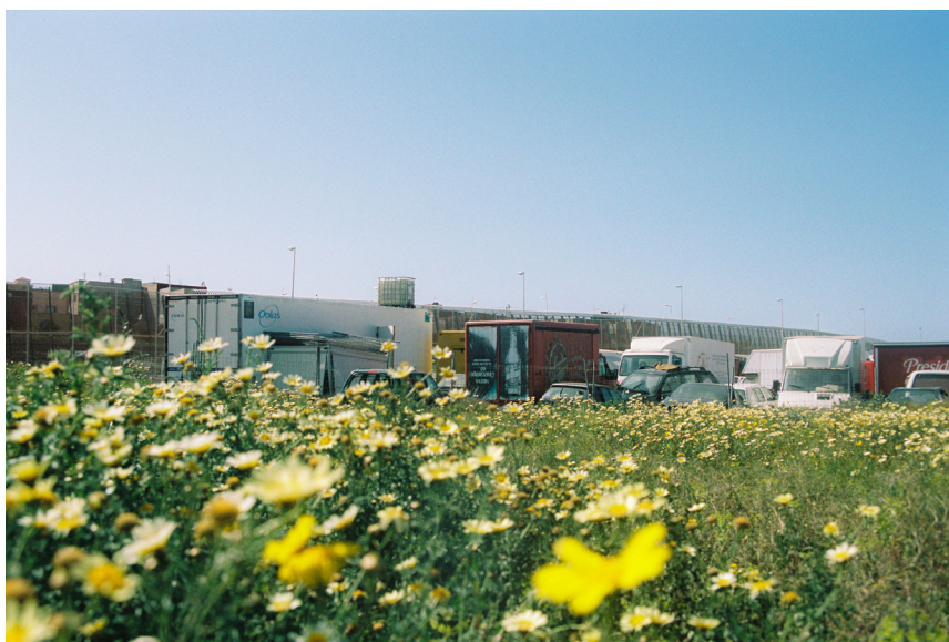
Rocio Madrid, Melilla , 2021 © Rocio Madrid