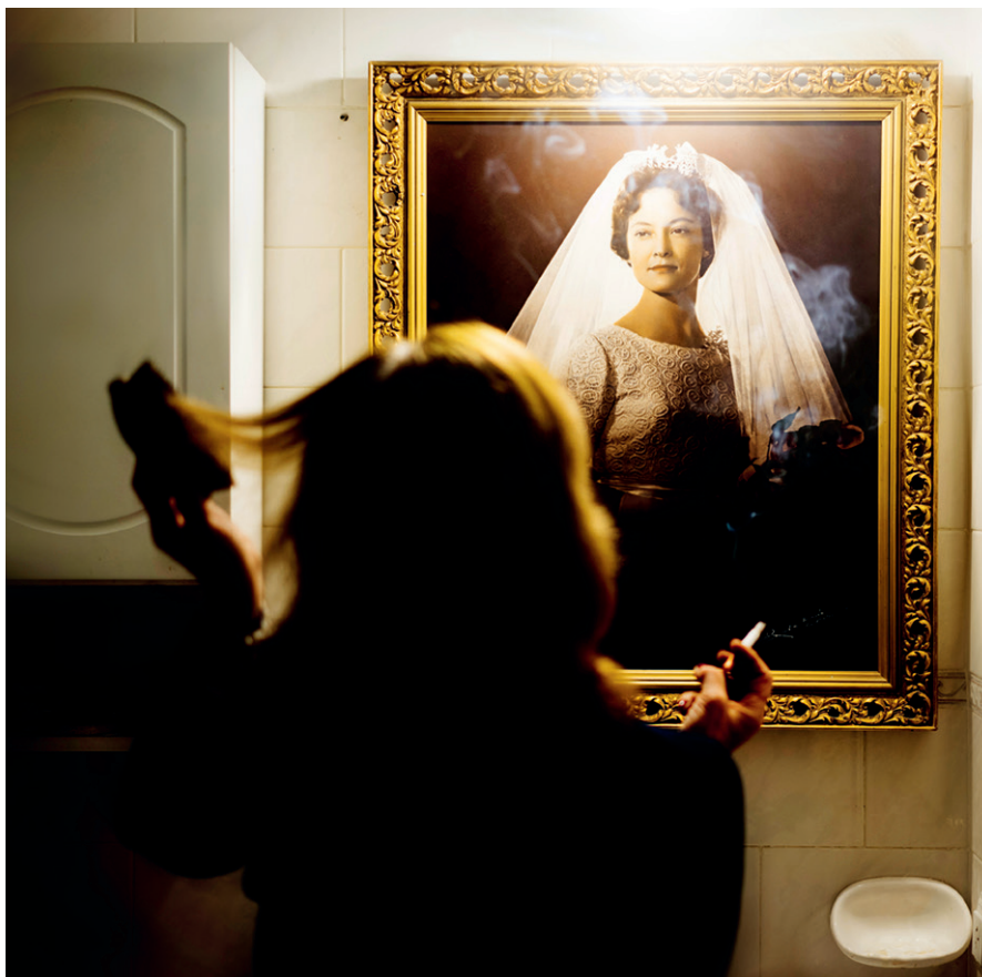
Lucía Morón, Te amo. Yo tampoco. , 2021 © Lucía Morón

«Fa un cert temps vaig acompanyar la mare a buidar la casa de l'àvia.