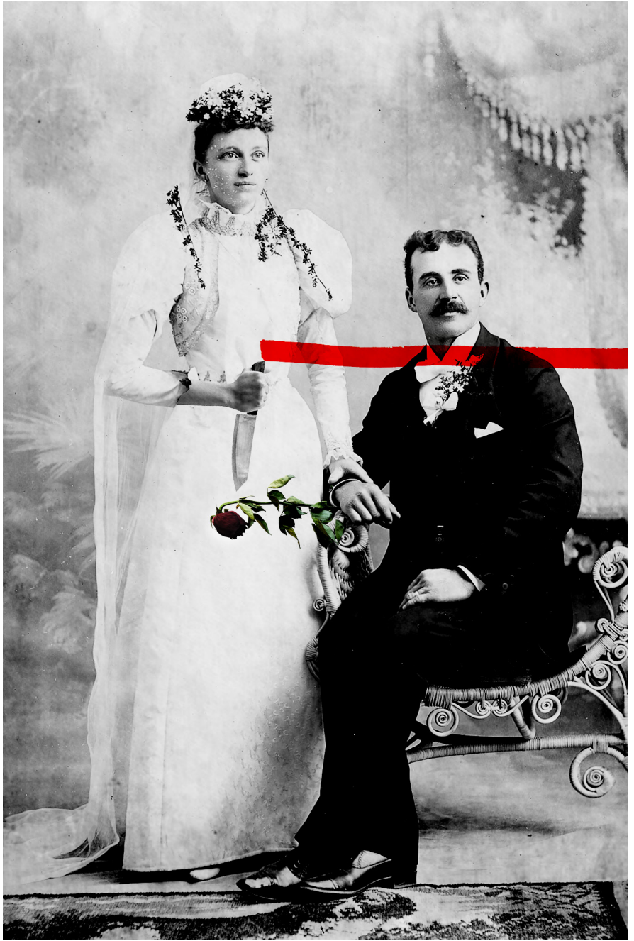
Lucía Morón, Asesinato romántico , 2023. Part de la sèrie Simplemente cortando . © Lucía Morón