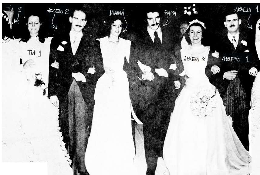
Lucía Morón, Te amo. Yo tampoco. , 2021