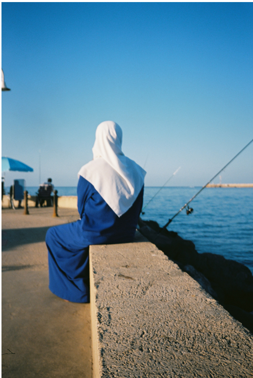
Rocio Madrid, Melilla , 2021