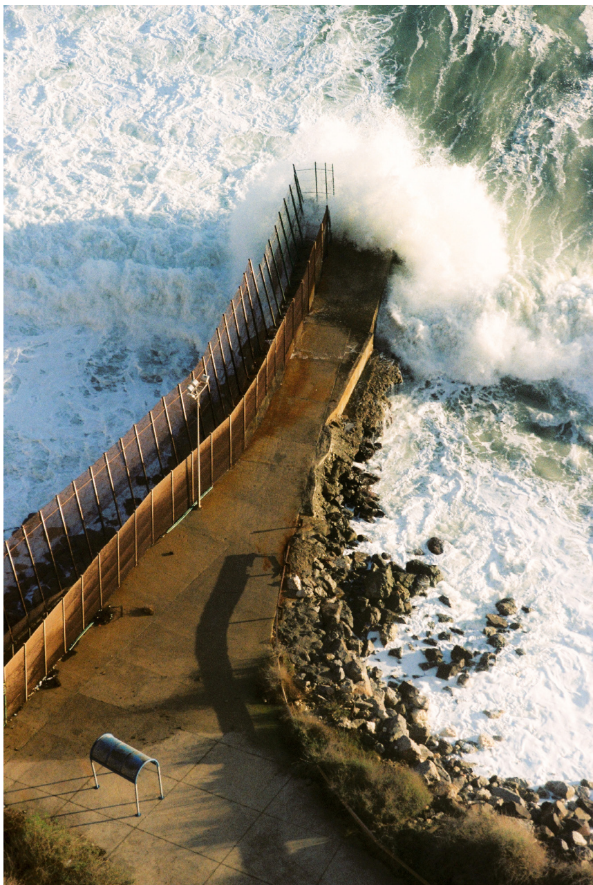
Rocío Madrid, Melilla , 2021 © Rocío Madrid