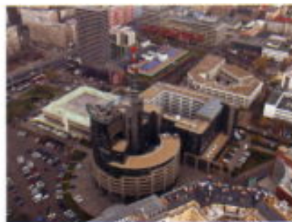
Vista aérea del Cuartel General de la Policía, construido en 1997.