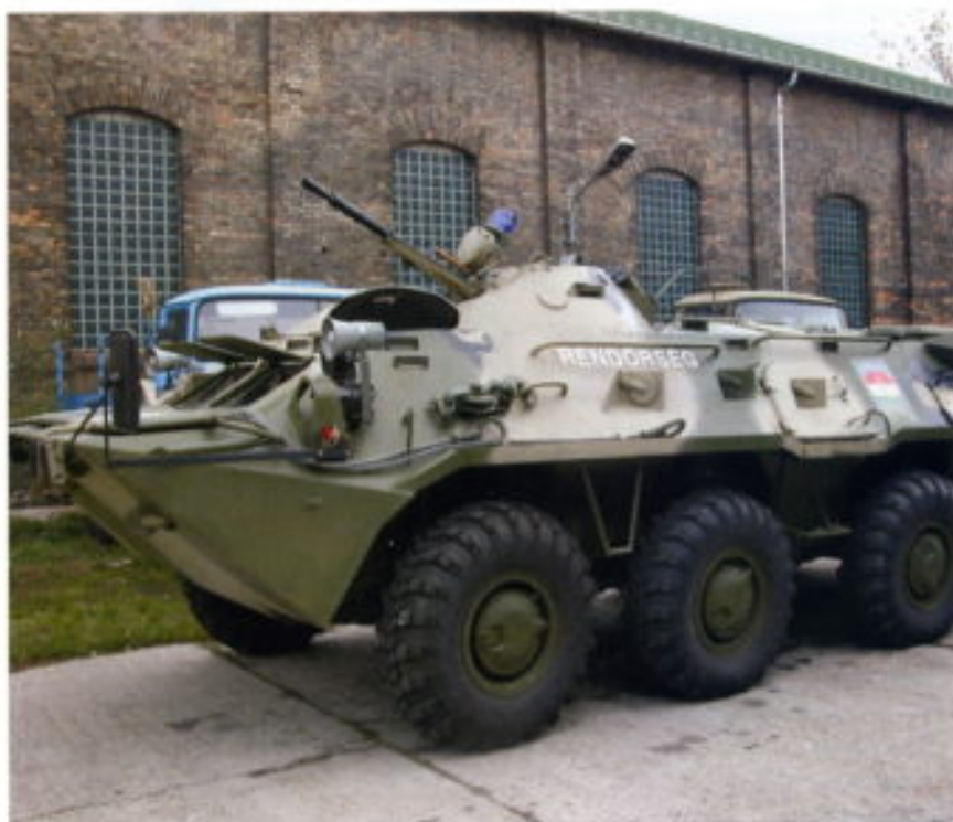
Vehículo blindado. Es el vehículo policial más pesado: el BTR de 13 toneladas, anfíbio, que desarrolla en el agua una velocidad de 8 km/h y en tierra puede alcanzar hasta los 90 km/h en carretera. Tiene una tripulación de tres hombres y puede transportar hasta ocho efectivos policiales.

delincuencia está la instalación de cámaras de televisión en las calles. La experiencia comenzó en 1998 con 12 cámaras y ahora ya hay instaladas 96. Todo