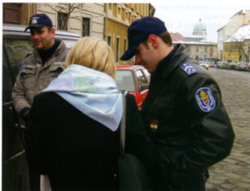
En contacto con la población.

La Policía se encuentra dentro de la Constitución de la República de Hungría