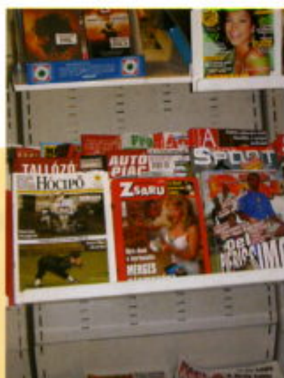
La revista se vende en los quioscos.

Después de haber conocido muchas revistas institucionales, esta publicación representa una novedad. Como sucede en cualquier otra revista, es un reto permanente para su plantilla, que vive de un presupuesto fruto del trabajo de sus componentes, impidiéndoles que se abandonen a la seguridad que representa una tirada pagada por una institución. Esto además les obliga a estar en permanente comunicación con sus lectores y actuar en consecuencia.