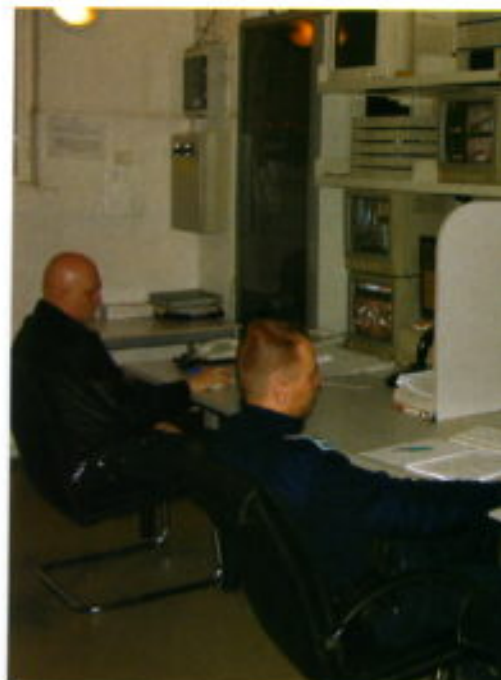
Sala de control de cámaras del Distrito VIII.

400 vigilantes. En la Ley de Policía de 1994 ya se prevé el establecimiento de patrullas mixtas entre policías y policías locales.