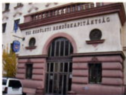
Distrito VIII, Josefóvros.