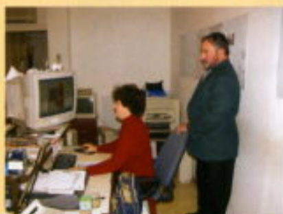
El Director de Zsaru controlando la edición.