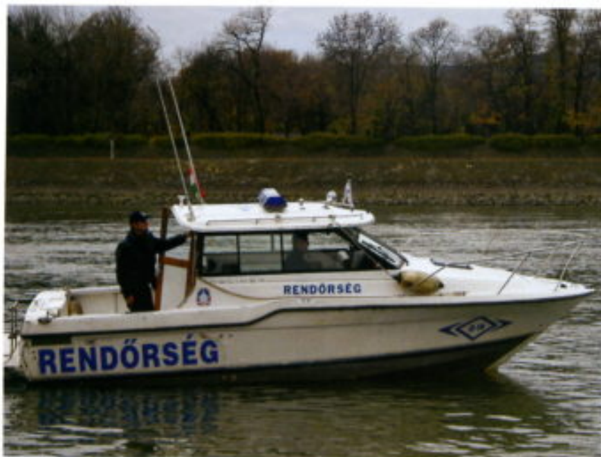
La Policía marítima en el Danubio.