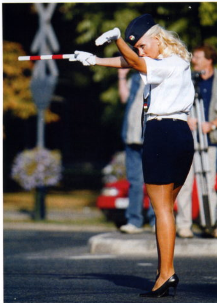
Las mujeres representan casi el 20 por ciento en la policía uniformada y casi el 60 por ciento en el personal civil. Sus bajas maternales tienen tres años de duración.

resultaba imposible poder tener patrullas con policía masculino y policía femenino.