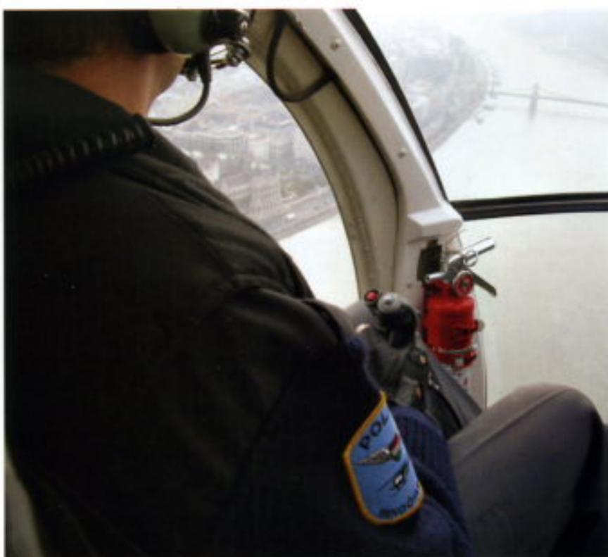
El Danubio a su paso por Budapest desde el helicóptero de la Policía.

La peculiaridad de este distrito radica que entre los métodos para controlar la