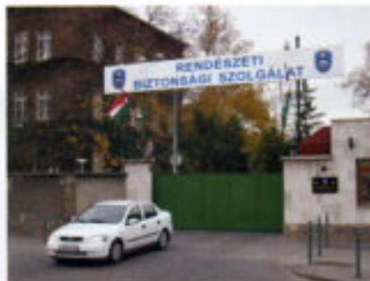
Acuartelamiento del Servicio de Seguridad.