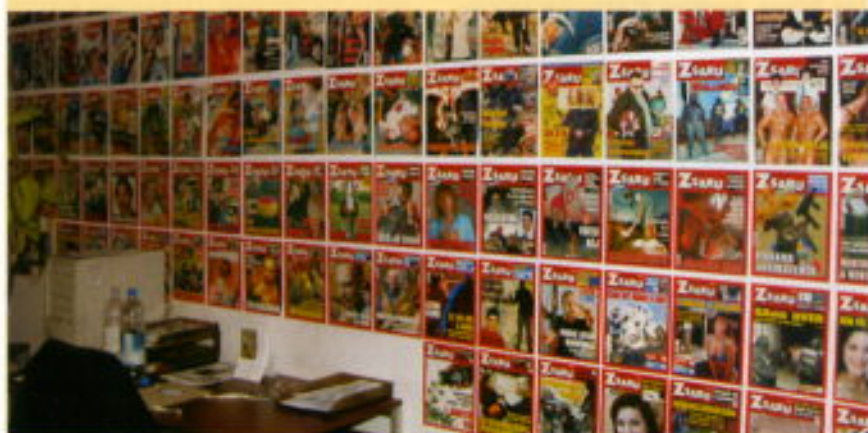
Diversas portadas de Zsaru.