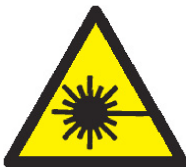
Figura 2 Etiqueta de advertencia

Además de la información contenida en las etiquetas explicativas descrita en la figura 3 , los productos láser, con excepción de los de la Clase 1, deben contener cierta información relativa a las características técnicas, como la potencia máxima de la radiación emitida, la duración del pulso (si ha lugar) y las longitudes de onda emitidas, así como el nombre y la fecha de publicación de la norma en la que se basa la clasificación del producto. Para los láseres de Clase 1 y 1 M esta información tiene que estar contenida en el manual de información del usuario, en lugar de suministrarla en las correspondientes etiquetas adheridas al producto.