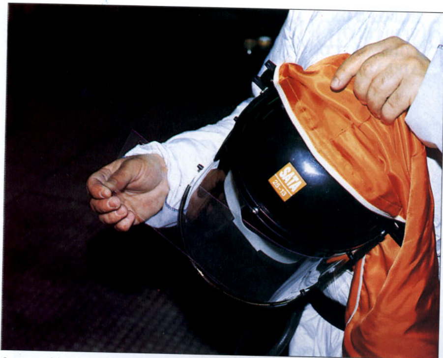
Sustitución del plástico protector de la visera.