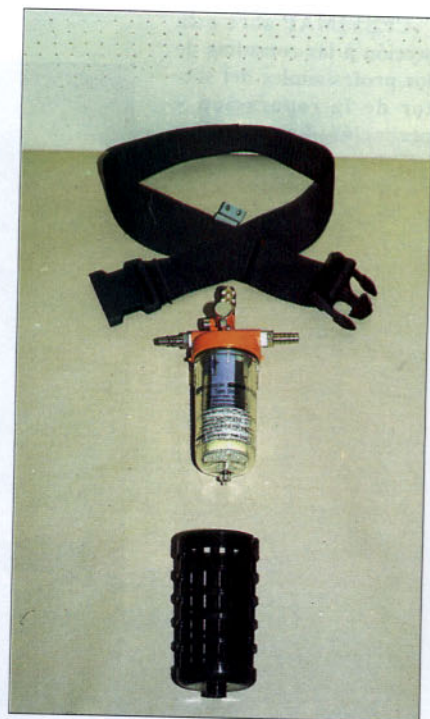
Filtro de carbón activo recambiable.

Este equipo no presenta limitaciones en su utilización; no obstante, para asegurar