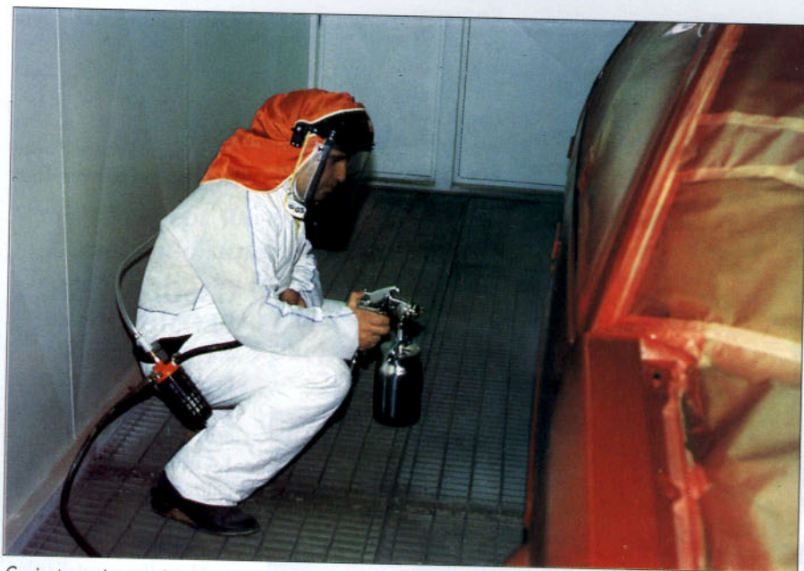
Conjunto equipo respiratorio.

una absoluta autonomía para desplazarse libremente por toda la zona de pintura.