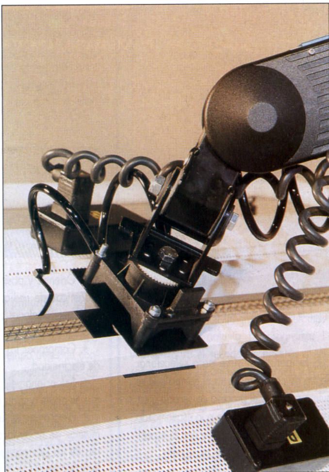
Sistema de articulación brazo-panel de pantallas de radiación.