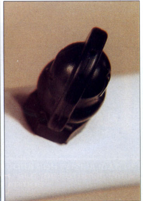
Sistema de movimiento de aire (entrada de aire comprimido, un regulador de caudal de aire de salida y conjunto de boquillas para la salida del aire).