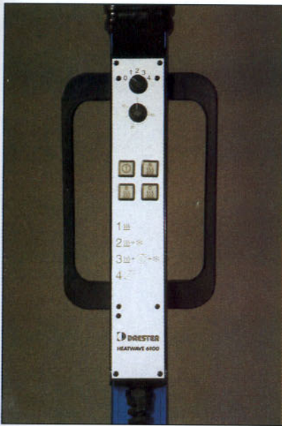
Panel de mandos.

El temporizador sirve para seleccionar dentro de cada programa el tiempo que se quiere que dure el proceso de secado o curado de la pintura acorde a lo especificado por el fabricante de pintura y con lo especificado en el Cuadro 2 que se adjunta.