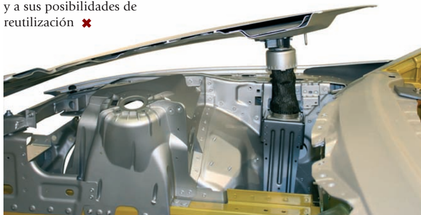
Dispositivo pirotécnico de un capó activo

disponen de dispositivos pirotécnicos, que elevan ligeramente el capó para amortiguar el impacto entre peatón y vehículo