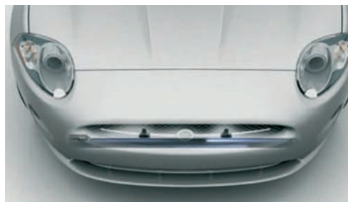
Sensores del capó activo

generales, se trata de capós totalmente cerrados, con lo que cualquier pequeña deformación habrá que repararla con martillo de inercia, trabajando desde el exterior. En el caso de capós de aluminio, se precisará un equipo específico para la soldadura de clavos. Si se trata de un capó activo, hay que tener en cuenta las recomendaciones del fabricante, en lo concerniente a la manipulación de los diferentes elementos y a sus posibilidades de reutilización ❌