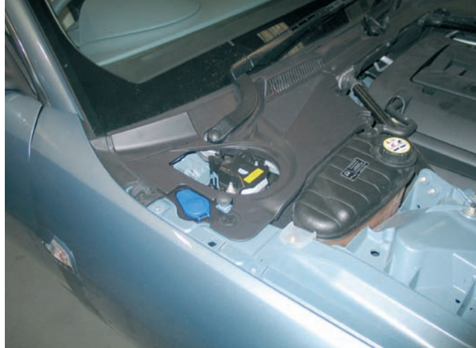
Unidad airbag de un capó activo

Determinados modelos de vehículos están comenzando a montar capós activos, dotados de un sistema de seguridad, diseñado para elevar el capó a una determinada altura, amortiguando el impacto entre el peatón y el vehículo. El sistema está constituido por un sensor de impactos para peatones, montado sobre la travesía del paragolpes, consistente en un anillo de fibra óptica, y dos decelerómetros situados por detrás del paragolpes (uno a cada lado). En caso de colisión, estos elementos envían la información al módulo de control y, si éste interpreta que se trata de un peatón y que el vehículo está dentro de la gama de velocidades predeterminada, dispara dos pirotécnicos, que liberan los pestillos de las cerraduras y, a continuación, las dos unidades airbags situadas a cada lado del capó. Estos desarrollos también tendrán su incidencia en el taller reparador. En líneas