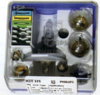
Lámparas de repuesto