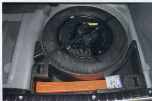
Rueda de repuesto

Los turismos de servicio público ya no estarán obligados a llevar recambio de bujías, platinos (aquellos con motor de gasolina o GLP), correas y manguitos de refrigeración; han de acogerse a las exigencias de un turismo normal, además de disponer de un equipo homologado de extinción de incendios adecuado y en condiciones de uso.