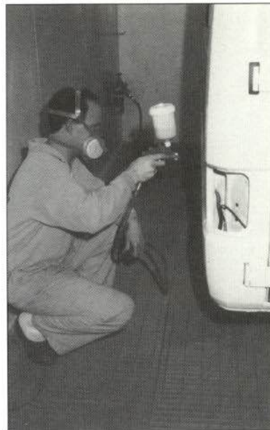
Figura 3.—Aplicación de masilla en grandes superficies.

Productos de poliéster de gran densidad, adecuados para el relleno de irregularidades sobre superficies metálicas de grandes dimensiones.