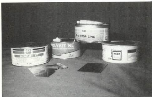
Figura 2.—Masillas para superficies cincadas o galvanizadas.

Debido a su composición, están especialmente recomendadas para su aplicación sobre superficies cincadas o galvanizadas, en las que el empleo de otras masillas podría originar problemas de adherencia.