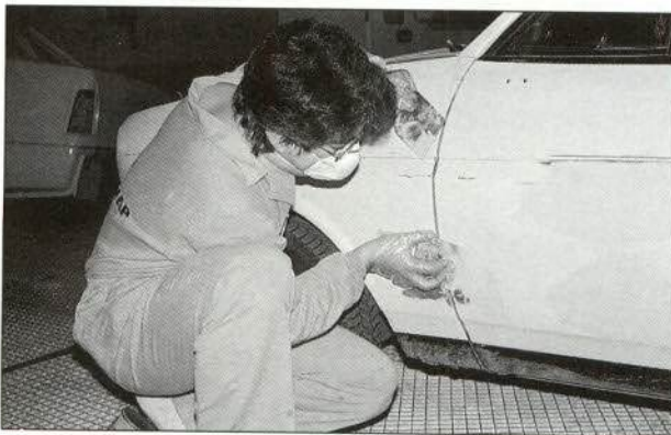
Figura 1.—Aplicación de masilla con espátula flexible.

Aunque la aplicación se realiza normalmente con espátulas flexibles, algunos fabricantes disponen de masillas que pueden ser aplicadas a brocha o utilizando una pistola aerográfica de gravedad, para lo cual, solamente es necesario variar la viscosidad del producto con el diluyente apropiado.