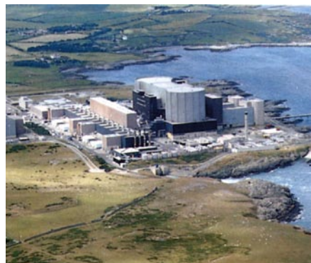
Central nuclear de Oldbury

La Inspección de las Instalaciones Nucleares, órgano regulador del Reino Unido, ha prorrogado el permiso de funcionamiento del reactor tipo Magnox número 2 de la central nuclear de Oldbury, que entró en funcionamiento en 1968, por un periodo de dos años tras haber comprobado su seguridad.