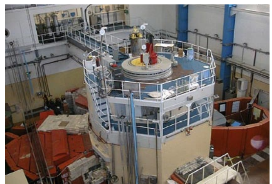
Vista de un reactor de investigación