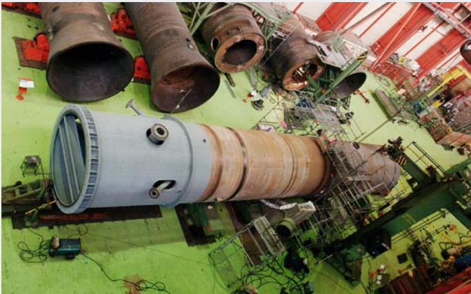
Grandes componentes de ENSA en su fábrica de Maliaño (Cantabria)

Se abren varios caminos para compartir el futuro mercado de reactores nucleares por parte de los suministradores para disponer de suficientes forjas: uno es el de llegar a acuerdos con JSW, otro el de ampliar la capacidad de sus actuales instalaciones, y un tercero de construir nuevas instalaciones.