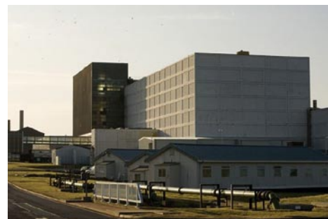
Vista externa del reactor Rápido Prototipo de Dounreay