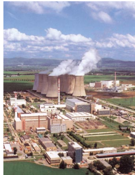
Central nuclear de Bohunice