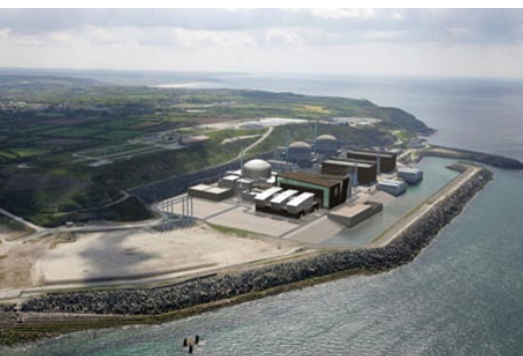
Representación infográfica del tercer reactor de la central nuclear de Flamanville