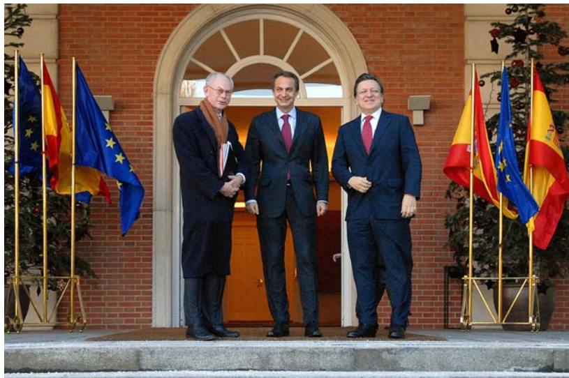
08/01/2010. El Presidente del Gobierno con los Presidentes del Consejo Europeo y de la Comisión Europea.

Iremos informando de éstas y otras actividades relacionadas con la prevención de riesgos laborales, bajo la presidencia española de la Unión Europea.