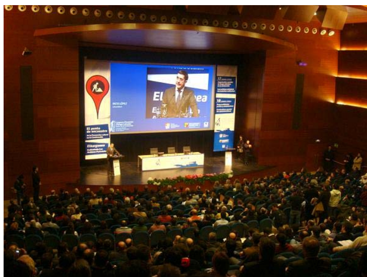
Patxi López, lehendakari del Gobierno Vasco, en la inauguración del Congreso.

Se puede obtener más información del Congreso en la siguiente dirección de Internet: Congreso prevención riesgos laborales construcción .