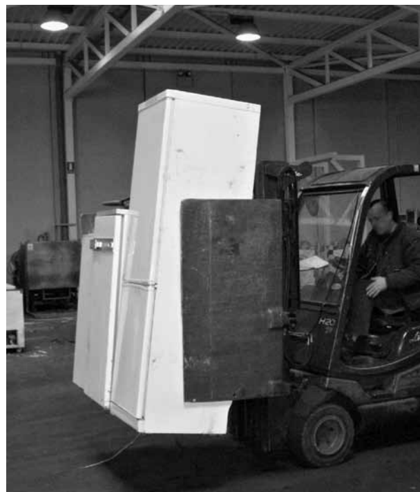
Figura 2. Carretilla para la manipulación de los frigoríficos

Para realizar el vaciado del gas del circuito de refrigeración se utiliza un equipo de aspiración compacto, que