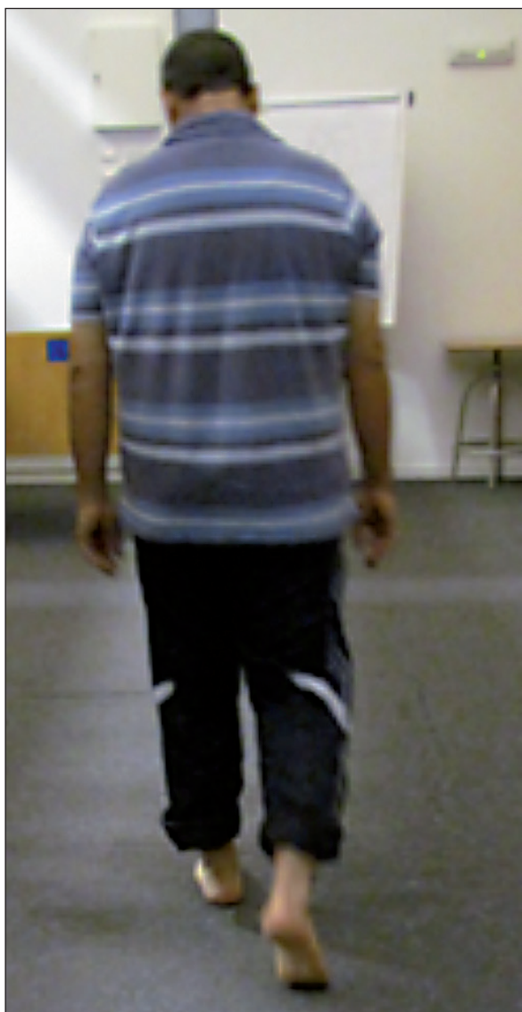
Figura 1. Análisis de la marcha.

Se registraron al menos 6 pisadas con cada pie. El índice de normalidad corresponde al promedio ponderado de la valoración en porcentaje de normalidad de todos los parámetros analizados en esta prueba. Se calcula de forma global para los dos miembros inferiores y para el derecho e izquierdo individualmente. Valores inferiores al 90% se consideran no normales o alterados funcionalmente.