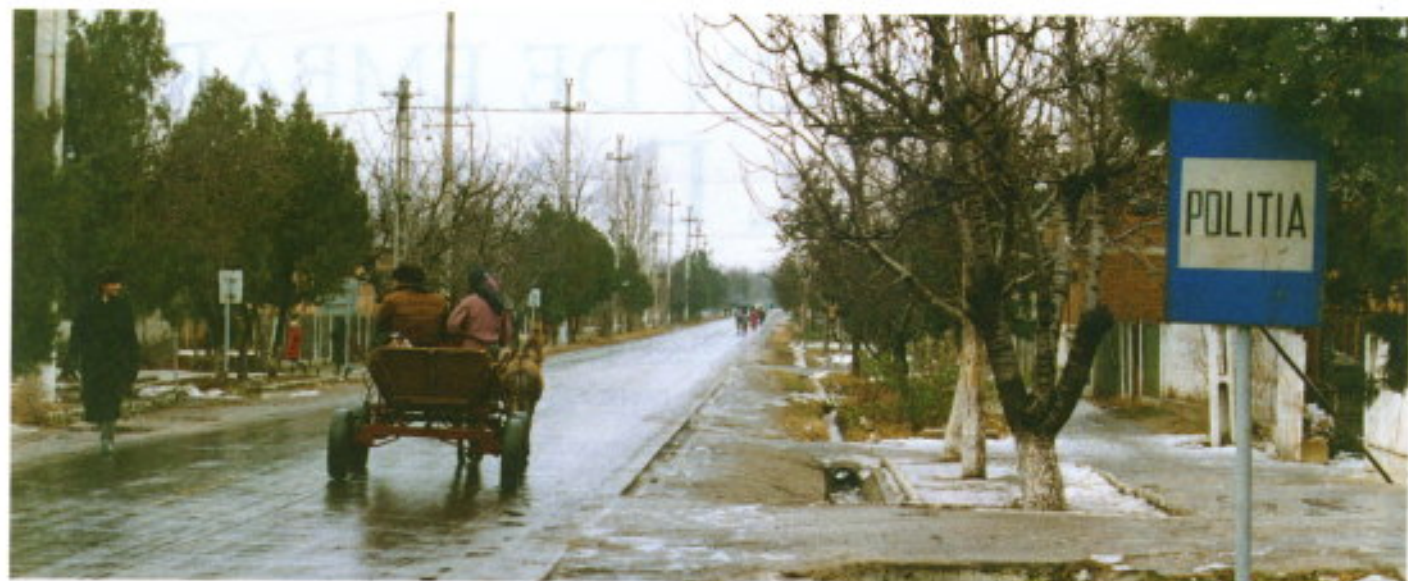
En los pueblos rumanos el único cartel que hay sobre la calzada es el de "Policía", que siempre está en un extremo.

después del Pentágono americano, es la segunda superficie más grande construida en el mundo. A pesar de lo que pudiera creerse, se enseña como orgullo rumano, por estar construida totalmente con materiales del país. También se visitaron los castillos de Peles (del primer rey rumano) y el turístico del Conde Drácula, en Transilvania.