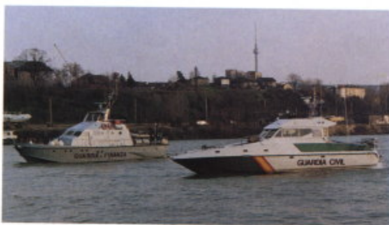
Países mediterráneos en el Danubio.

Para regresar a casa se puede utilizar el taxi que siempre hay en la puerta. Su