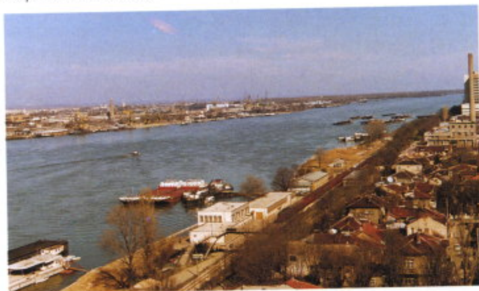
El Danubio: Calle para dos pueblos.

jes se aprovechan para los que quieran visitar la ciudad.