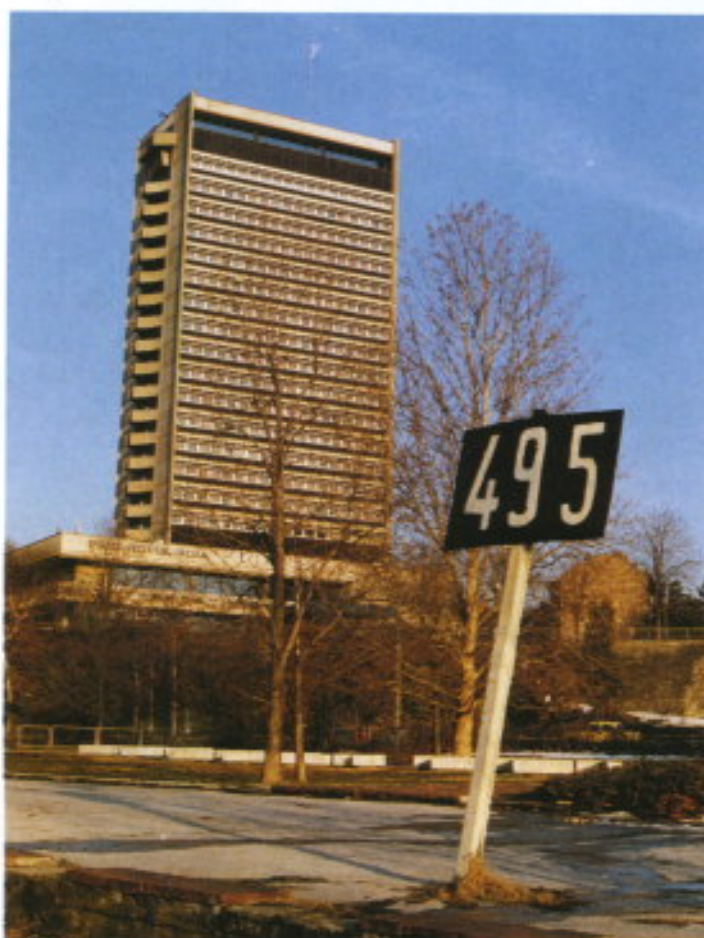
Hotel Riga, situado en el kilómetro 495 del Danubio.

Junto con ellos, el Tango y el grupo de inspección, a bordo de la embarcación que está de servicio, suben al con-