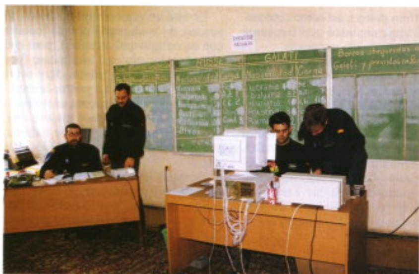
Sala de situación y despacho del Leader.