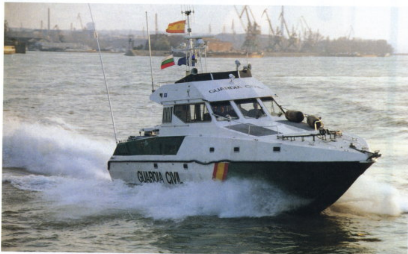
La embarcación de la Guardia Civil desplazada para la vigilancia del embargo.