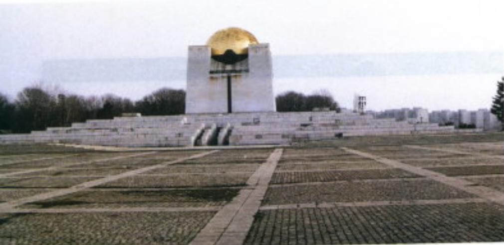
"La plaza del huevo frito", en Rousse.