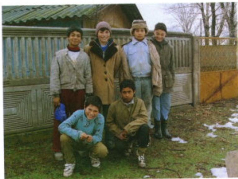
La juventud rumana.