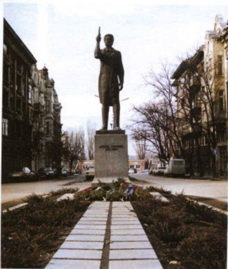
"El tío de la pistola"

El café es expreso, y en los restaurantes no se encuentra leche, solamen-