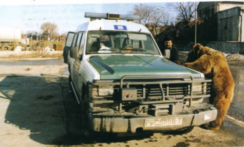
El del oso.

realizar más actividades y resulta mucho más económico.