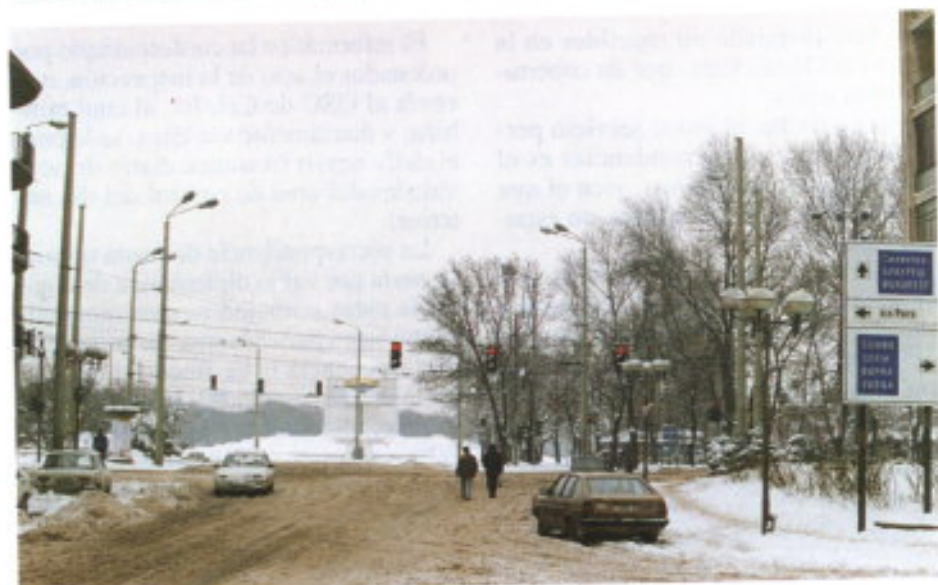
Los problemas de la nieve.