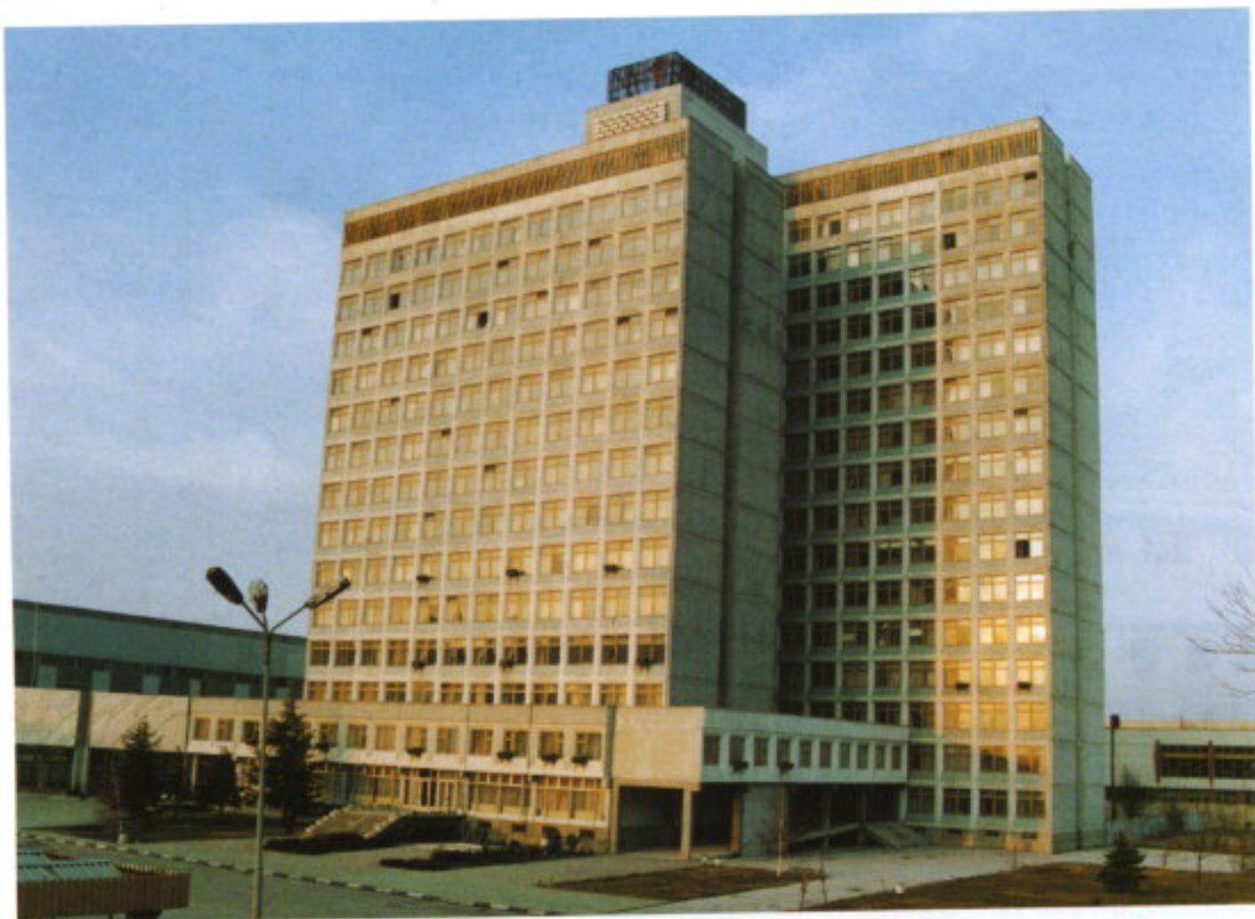
El Centro de Mando está situado en la Fábrica SABODA, en Rousse.

te está el equipo de inspección, compuesto por ocho hombres, todos ellos guardias civiles.