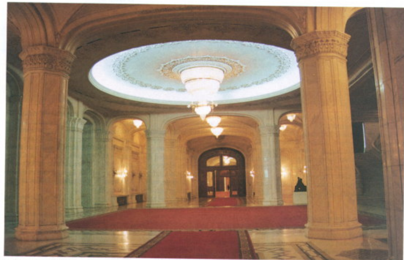
Palacio de Ceaucescu.